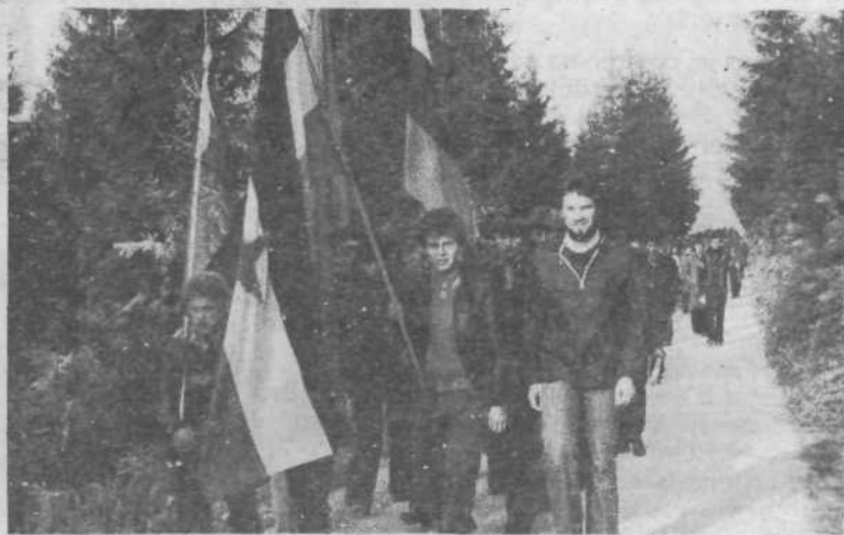
Pohodna brigada X. SNOUB Ljubljanska, ki jo je organizirala OK ZSMS Ljubljana Center, na poti na Ilovo goro.