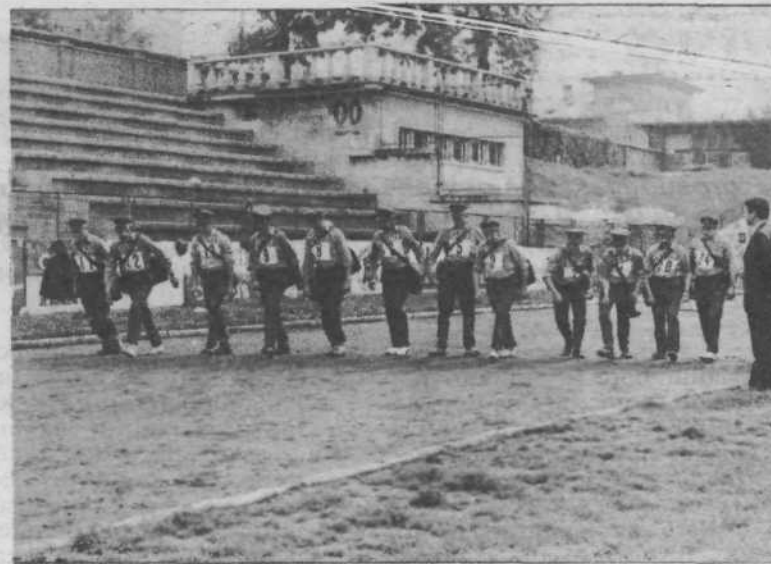
Tekmovanje poštarjev v hitri hoji

movalci. Ti se udeležujejo vseh množičnih trim tekmovanj, njihove vrste pa se nenehno večajo. Lani smo dobili plaketo občine za množično udeležbo na vseh organiziranih tekmovanjih, uspešno pa sodelujemo tudi na športnih igrah ptt delavcev Slovenije in Jugoslavije. Mimogrede: letos smo bili v Sloveniji 2., za Celjem.