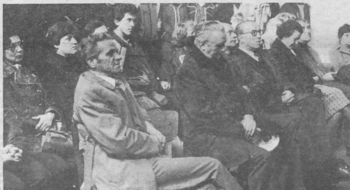
Udeleženci bitke na Ilovi gori so obudili spomine nanjo.