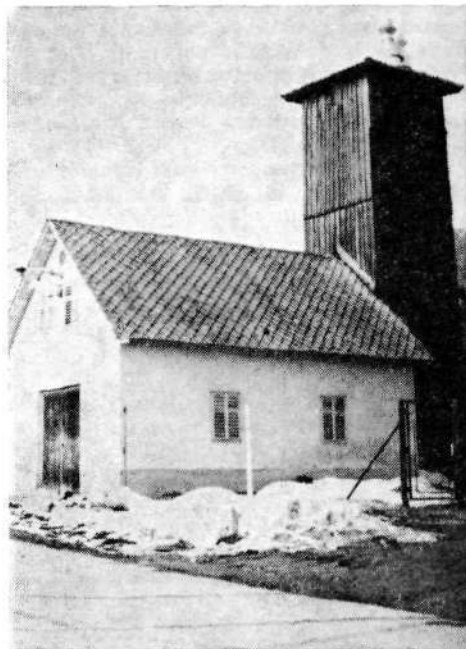
Gasilski dom na Dobračevi, ki je bil zgrajen leta 1902