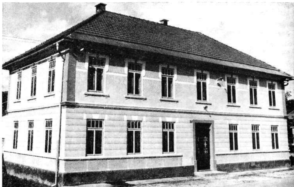
Stavba, ki je bila kupljena za potrebe gasilcev leta 1952