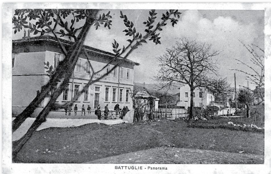
Slika 1: Šola v Batujah, poimenovana po intervencionistu Vittoriju Locchiju (1889–1917)