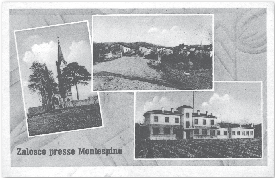
Slika 3: Šola v Zaloščah, zgrajena v tridesetih letih 20. stoletja