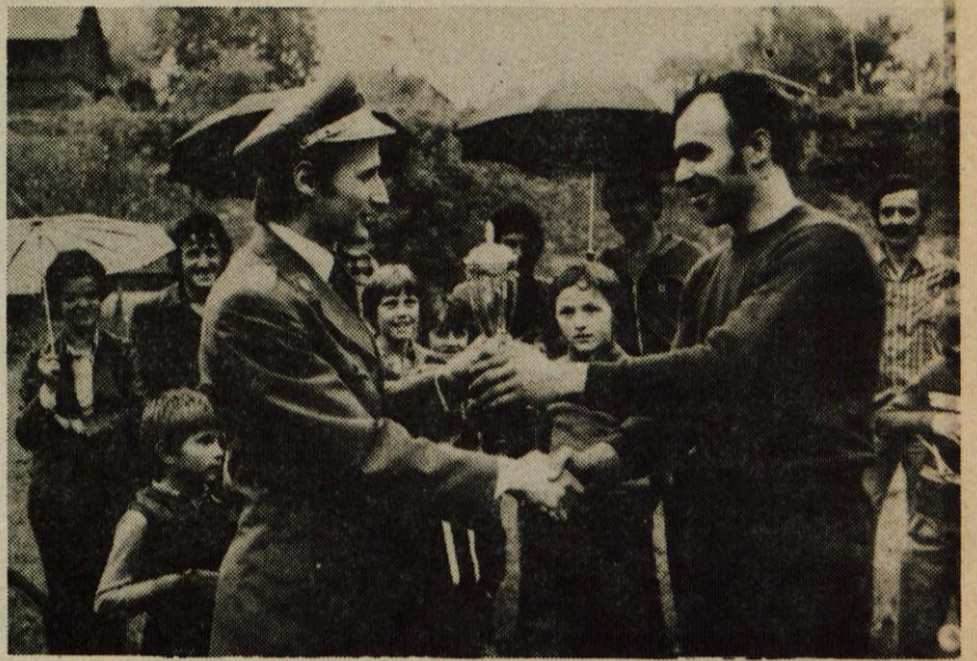
NOGOMET V POČASTITEV DNEVA VARNOSTI - V počastitev dneva varnosti, 13. maja, je bila v četrtke na nogometnem igrišču v Britofu zanimiva tekma med moštvoma Creine iz Kranja in kranjske Uprave javne varnosti.

Jesenice - V jeseniški občini se tudi športniki zelo aktivno vključujejo v praznovanje letošnjih jubilejev. Med drugim je komisija za šport in prireditve pri OK ZSMS Jesenice že organizirala več športnih srečanj mladih iz osnovnih organizacij ZSMS.