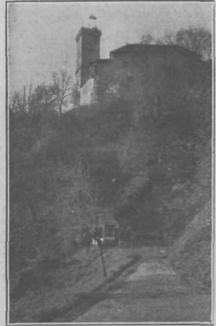
Ljubljanski grad od jugovzhoda

Nad čuvajevim stanovanjem vise že od nekdanj trije zvonovi, na katere je bil čuvaj plat zvona ob požaru. Kadar je bila ura na veliki, leta 1440. vlit zvon, je moral čuvaj ponoviti udarce na mali zvon in s tem je dokazal, da čuje. Mali zvon je pel nekdanj hudodelcem, kadar so jih vodili na morišče; zato so ga imenovali »zvon ubogih grešni-