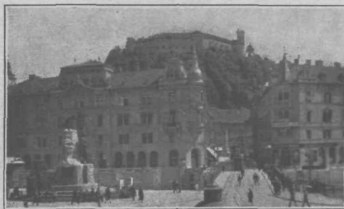
Ljubljanski Grad z Marijinega trga

Koroški vojvoda Ulrik III. je posedoval grad leta 1260. in ga leto pozneje odstopil oglejskemu patrijarhu Gregorju. Pozneje je prešel v