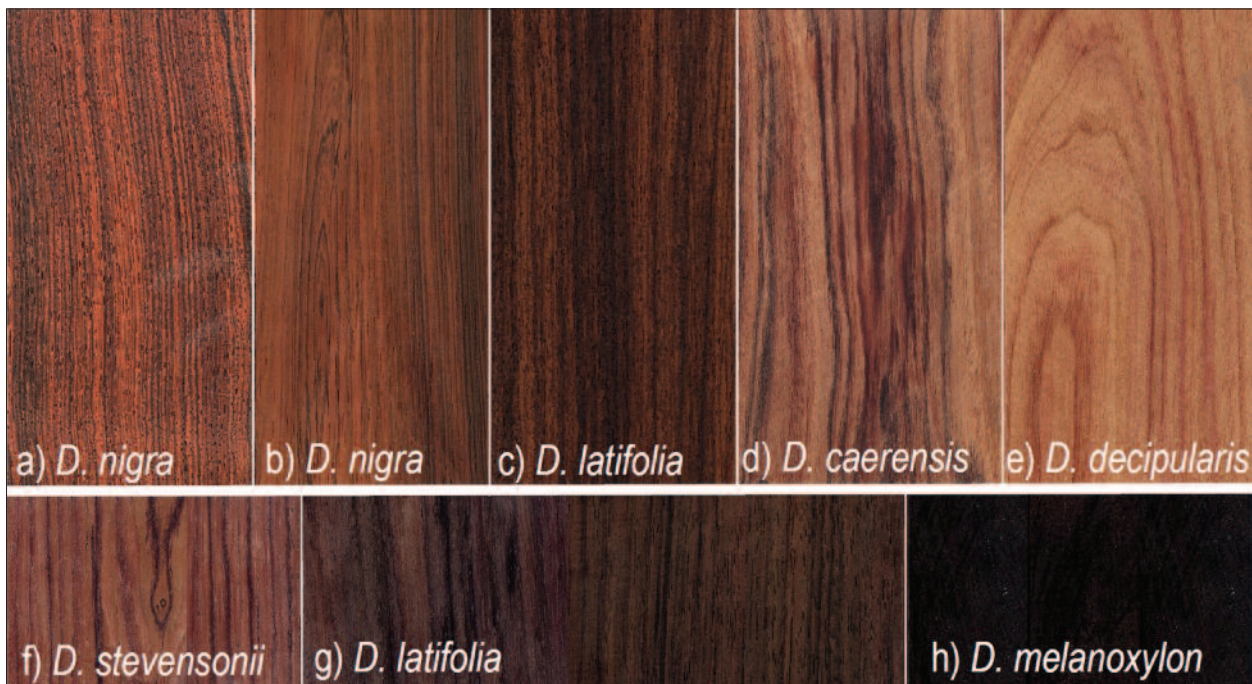
Slika 1. Videz izbranih vrst iz rodu Dalbergia . (a-e) zbirka furnirjev Palutan, (f-h) zbirka lesa na Oddelku za lesarstvo.

Zaščita po zakonodaji CITES zahteva zanesljivo prepoznavanje lesa zaščitene vrste in razlikovanje od tistih, ki niso zaščitene. Ker palisandri uspevajo v tropskem območju srednje in južne Amerike, Afrike in Azije, na naše območje prispejo kot les, furnir, plošče ali pa kot deli izdelkov, med katerimi so naj-