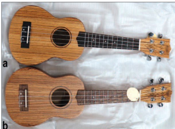
Slika 5. Primerjava inštrumentov istega modela: (a) model, izdelan pred letom 2017, ima ubiralko iz lesa palisandra, (b) model, dobavljen po uredbi 2017, pa ima ubiralko iz lesa ameriškega oreha ( Juglans nigra ).

Figure 4. Inspection of instruments at customs.