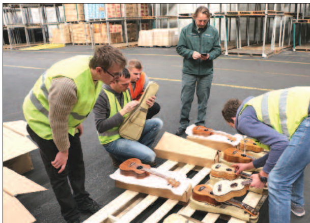
Slika 4. Pregled inštrumentov na carini.

Izbor pomembnih vrst iz rodu Dalbergia kaže, da je njihovo zgradbo mogoče dokaj natančno opisati z naborom anatomskih znakov kot so: difuzno porozen razpored trahej s tangencialnim premerom 100–200 µm, intervaskularne piknje so okrašene (z izrastki), trakovi so homogeni in v etažah, aksialni