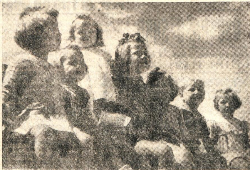
Kdo bi ne bil vesel takih zdravih, mladih korenjakov? V življenju se gotovo ne bodo ustrašili nobenih težav.

fonda smo za to pomoč vse premalo hvaležni. Premalo mišlamo na to, da je pomoč prihajala k nam ravno ob času, ko smo imeli največje težave v prehrani in v našem socialističnem gospodarstvu sploh, najprej zaradi dobro poznane sovražne informbirojevske politike, potem