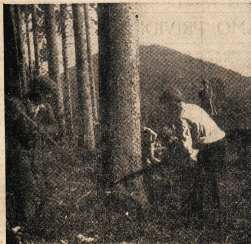
Gozdovi so naše veliko narodno bogastvo. Ali dovolj skrbimo zanjet?

Frontovci kočevskega okraja so podarili za zgraditev kulturnega doma Slovencev v Trstu 72.000 din. Zbiranje denarnih prispevkov se nadaljuje.