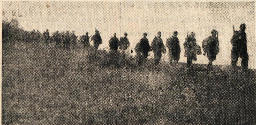
Partizani na pohodu

pojavi Italijani, ker so zvedeli, da se tam zbirajo partizani. Vleed hudega snežnega meteža, ki je sproti zavejal gazi, niso našli poti za partizani in so se brez uspeha vrnili v Semic.