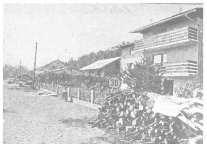
V enem predelu krajevne skupnosti Kozarje stanovanci počistijo le dvorišča, vso odvečno kramo pa postavijo za »svojo ograjo«.