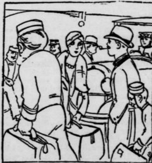
predstavljajo tujski promet v dneh pevskih svečanosti