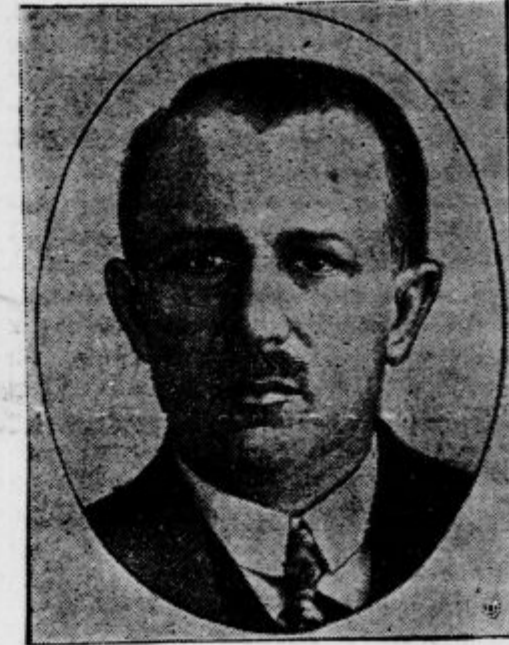
Min. predsednik Bartl

Varšava, 22. julija. Uradno se potrjuje vest, da je prišlo med Pilsudskim in ministrskim predsednikom prof. Bartlom do ostrega spora. Bartl bo najbrže demisioniral.