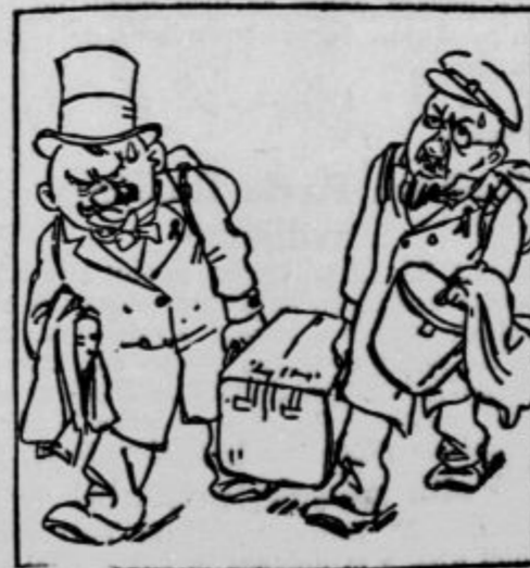
— in kakšen bo najbrž končni rezultat