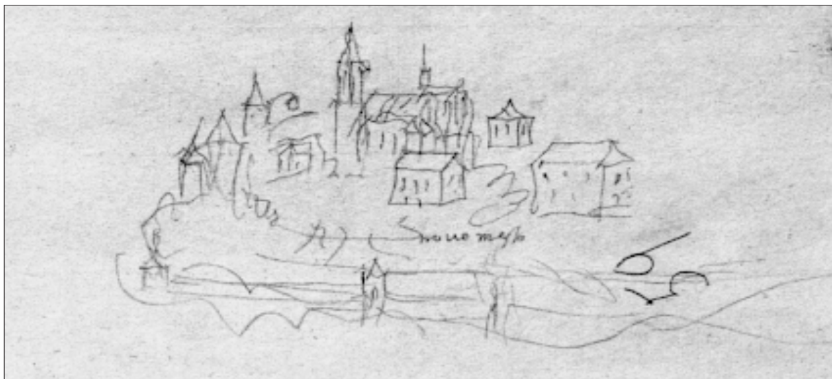
Novo mesto po Clobuccarichevi skici (1601–1605), neposredno po kugi leta 1599.

tega časa: tako naj bi na znaten upad tranzitne trgovine vplival zlasti padec Bihaća in Kaniže. 42