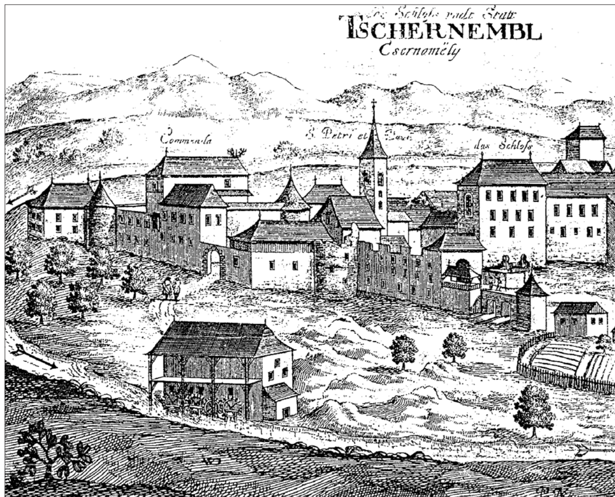
Črnomelj po Valvasorju desetletje pred kugo 1691; sredi mesta stoji župnijska cerkev sv. Petra in Pavla s pokopališčem, kjer so pokopavali kužne mrliče.