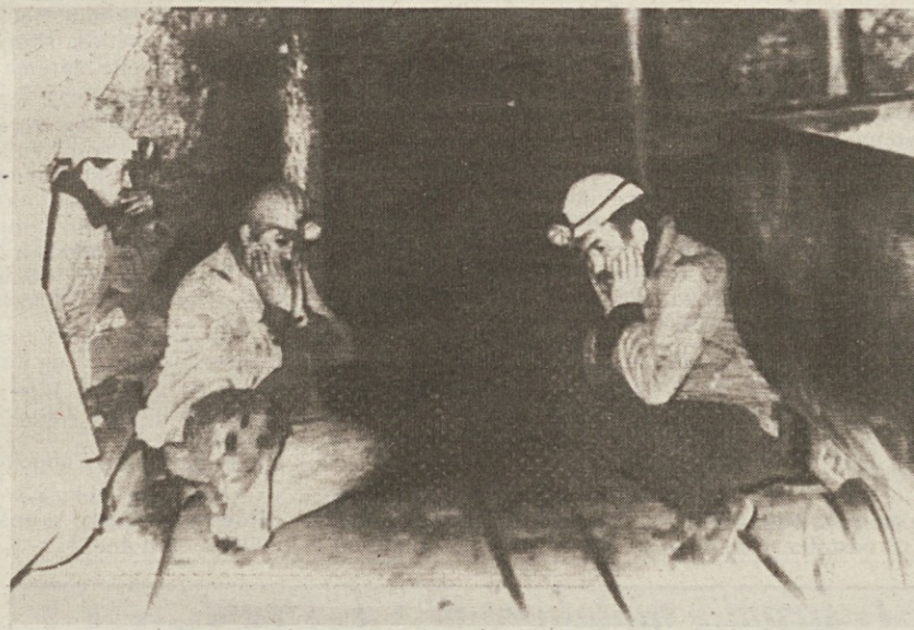
Nemoč delovnih tovarišev pred rudniškimi okni

ANKARA — Eksplozija treskavih plinov v rudniku lignita Yeniceleek pri Merzifonu (340 kilometrov severovzhodno od Ankare) je predpovednim povzročila pravo tragedijo. Reševalne ekipe so iz gorečih jaškov povlekle dva težka ranjena in devet trupel, usoda drugih 58 rudarjev, ki so ostali v jaških 350 metrov pod površjem pa je po mnenju izvedencev zaprečena. Po eksploziji je namreč izbruhnil požar, ki ga niso še pogasili, kljub temu da so nepropustno zaprli vsa rudniška okna. V rovih je koncentracija ogljikovega monoksida taka, da človek podleže v dveh minutah, tako da so oblasti prepovedale reševalcem, da se za 48 ur spustijo v jaške.