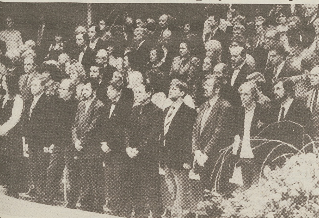
Na podelitvi priznanj v Cankarjevem domu je v sredo zadonela tudi slovenska himna (v prvi vrsti letošnji nagrajenci)