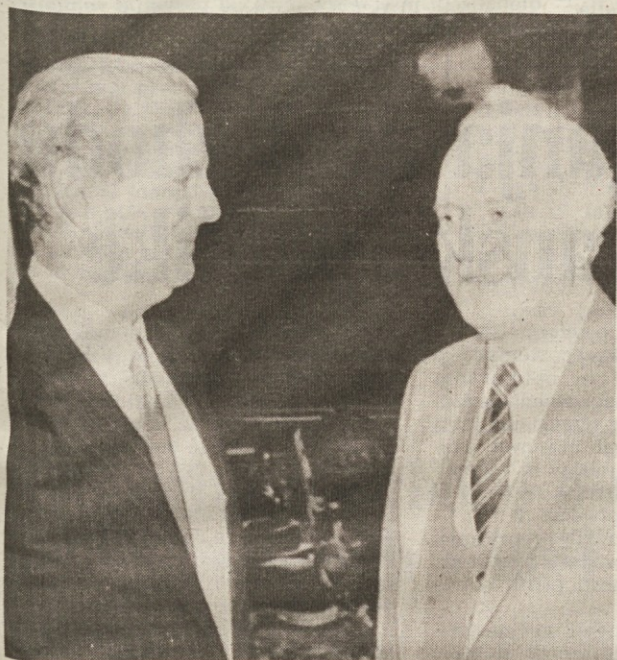
James Baker in Eduard Ševardnadze v Moskvi

Priprave na bodoči sporazum o 50-odstotnem krčenju strateškega orožja - Gorbačov bo sprejel Bakerja Razhajanja glede vprašanja o združitvi Nemčije - ZDA se ne strinjajo z njeno nevtralnostjo