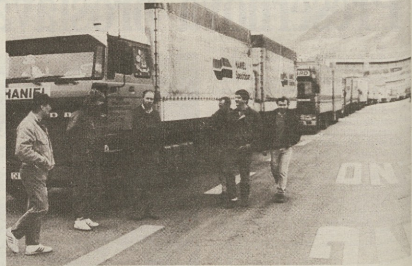
Položaj na mejnih prehodih se iz dneva v dan zapleta zaradi stavke osebja carinaric. Gornji posnetek je s terminala pri Brennerju, kjer je več stotin tovornjakov ustavljenih že od ponedeljka