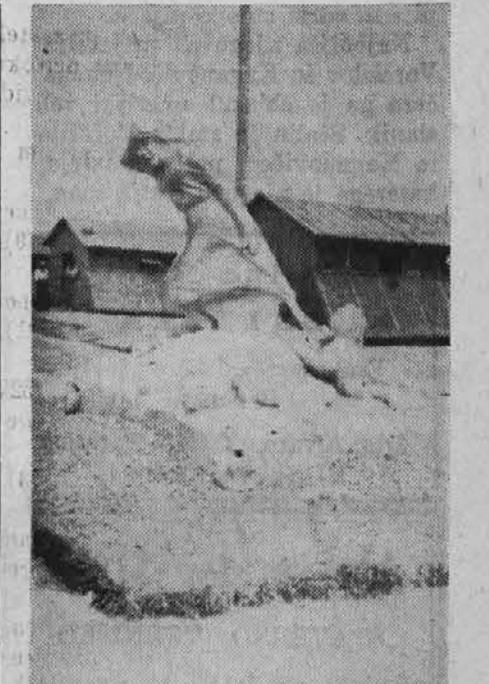
Spomenik španskim družinam, ubitih od fašističnega bombardiranja, postavljen poleg lagarjev; delo prostovoljcev.

Piši mi večkrat. Drugi dobivajo pisma, jaz sem pa žalosten, ko zame ni