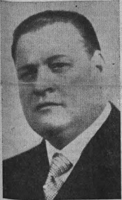
Predsednik Argentine, Ortiz

Če se bodo v Habani vsaj nekoliko sporazumeli glede najvažnejših vprašanj, bodisi gospodarstva, politične in vojaške obrambe, kar upamo, kajti kandidatura Roosevelta za tretjo predsedniško dobo bo k temu gotovo mnogo pripomoglo, tedaj je pričakovati veliko prosperitete v vseh panogah ameriškega gospodarstva, kar bo tudi na izseljenstvo ugodno vplivalo.