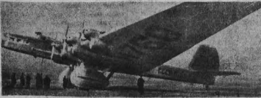
Eno izmed modernih ruskih potniških letal, ki tehta 40 kvintalov ter ima prostora za 64 potnikov

Prav za prav, bi ne smeli imenovati "čisti dobiček", ampak preveč uplačano, pri konsumnih zadrugah, oziroma premalo dobljeno pri rokodelskih ali proizvodnih zadrugah. Kajti zadruge niso zato, da delajo kake dobičke, ampak, da čim bolj, in pošteno poslužijo svoje članstvo. Ker pa je današnji red, posebno kar se trgovine tiče, še vedno liberalen in se nanj hočeš nočeš, morajo tudi zadruge ozirati, so pač primorane postaviti take cene, kakor so na ostalem trgu, oziroma sorazmerno nižje. Razumljivo je torej, da ako gre vse prav, mora ostati nekaj dobička, katerega zasebna trgovina spravi v svoj žep, a zadruge ga kot preostanek vrnejo nazaj, tistemu, kateri je k temu pripomogel; to je članstvo. Navadno se od celokupnega dobička določi 5% kot nagrada uradništvu, kajti umestno je tudi njih prištevat k čimteljem, kateri so do tega pripomogli. Le 5% od čistega dobička zahteva zakon, da se mora pripisati rezervnemu skladu, tako ostane navadno 90% za članstvo. Seveda se ta denar tudi lahko v druge svrhe porabi, kakor pač določijo sami člani, katerih je. Navadno se porabi za izobraževanje članstva, za šole, za športna igrišča in zadrugno propagando. Tu vidimo, da združništvo vedno gleda v prid skupnosti, dočim je zasebna trgovina porabila dobičke samo v zasebne svrhe. Ostane torej razmišljanje: ali so zadruge koristne ali ne? Na kar upamo, da si vsak lahko sam odgovori.