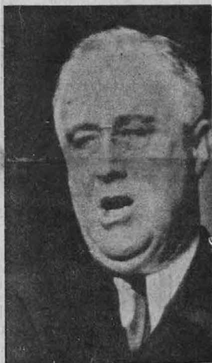
Predsednik Zdr. držav, Roosevelt

Po vsem tem kar smo napisali pa priporočamo slovenskemu izseljstvu, bodisi posameznikom, društvom in vsem, ki morejo in bi mogli razumeti resnični napredek, naj skušajo ustvarjati več skupnosti ter smotrnega izseljenskega delovanja.