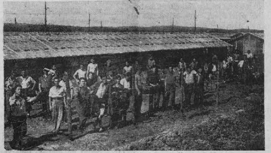
Španski republikanski bojovníki v Gursu (Francija), v ozadju lagarji

Precej prostovoljcev, med njimi tudi nekaj Slovencev, je odšlo v Rusijo in drugi v severno in južno Ameriko.