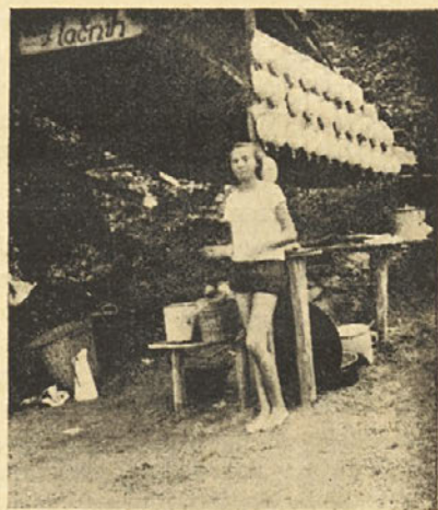
„Raj lačnih“ — taborna kuhinja