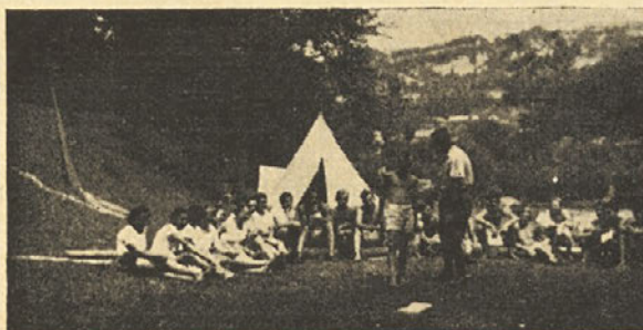
Taborenje sokolskega naraščaja ob Savinji Župni prednjak br. Prestor razlaga Tyršev telovadni sestav

Naša taborenja bodo vselej organizirana kot prave sokolske šole (glej članek »Sokolska taborenja« od br. Strniše v 9. številanskega »Župnega vestnika«!). Tako bodo pripomogla k idejni poglobitvi naših pripadnikov in k njihovem tehničnemu usposobljenju bodisi za vaditelje, bodisi za prosvetne delavce v naših društvih.