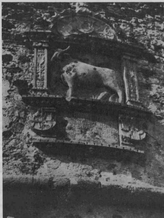
Plošča s turom in napisom iz 1520 danes.