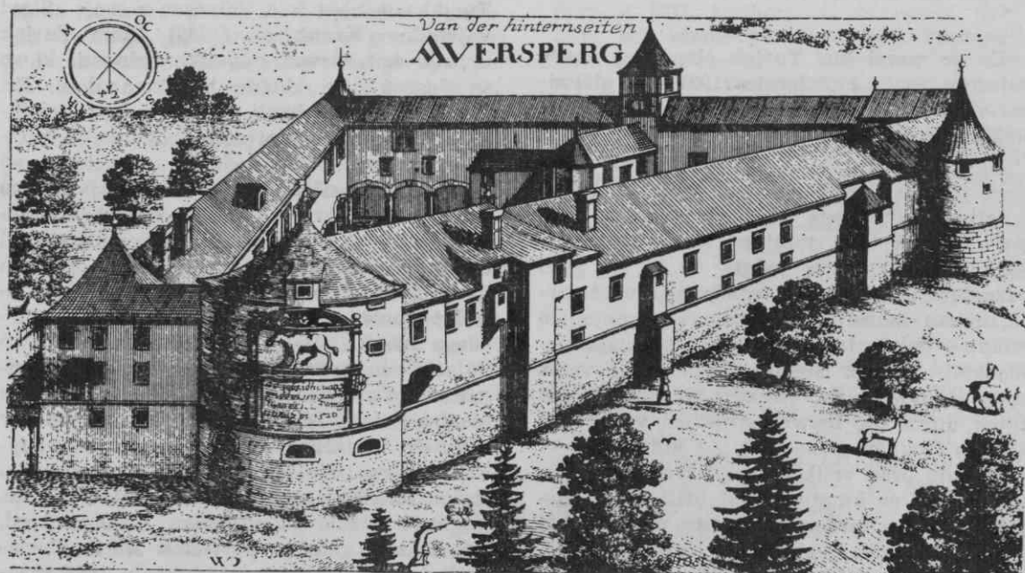
Turjak z zadnje strani z vzdano ploščo iz 1520 na stolpu (Valvasor, Topographia . . ., št. 15)

Ko sta 1467 delila posest brata Pankrac in Lovrenc Turjaška, se omenja samo »grad Turjak s pristavo in hribom« (das geslos Awersperg mit dem mayrhof vnd puchel). 29 Stari grad je omenjen še leta 1496, ko je kralj Maksimiljan I. podelil Volkartu Turjaškemu in sinovom Pankraca »grad Turjak in stari grad poleg z grajskim hribom, z ljudmi in posestmi« (das haus Aursperg und