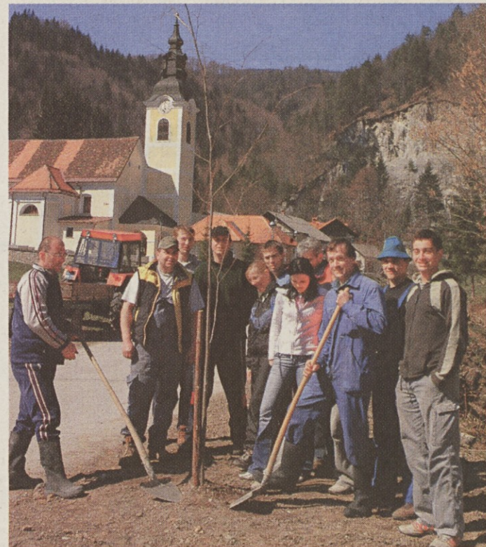
Zagnani člani Gasilskega, Turističnega in Športnega društva Špitalič in krajanje so ob zaključku čistilne akcije za čisto Tuhinjsko dolino v soboto, 8. aprila, ponosno zasadili 16 lip.