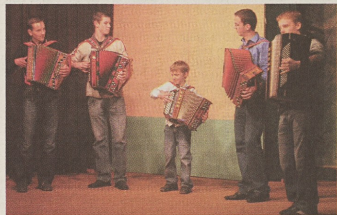
Mladi harmonikarji so ogreli dlani.