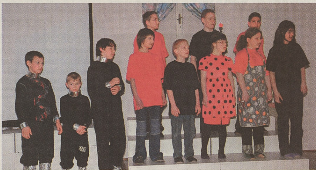
Šolski pevski zbor je prepeval v pozdrav mamam in pomladi.

Učenci in učitelji OŠ 27. julij Kamnik so 4. aprila pripravili pristrčno prireditev, posvečeno predvsem mamam, pa tudi pomladi. Pesmice in igrice, ki so jih poklonili za darilo, so ogrele srca številnih obiskovalcev. »Nič zato, če se je to zgodilo šele v aprilu, saj je treba mame razvajati