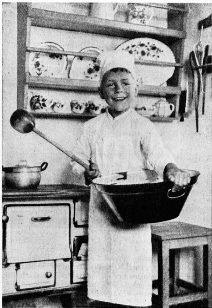
V službi božičnih dobrot.

tudi on je imel svoje napake. In če se jih je zaporedoma otresel, je to dosegel le tako, da se je za to stalno prizadeval. (Dalje.)