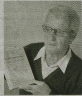
Avtor: Jože Debevc

Ljubljanska 21 K, ob pekarni Duplica, tel. 01/8310-380 www.kontiki-solar.si