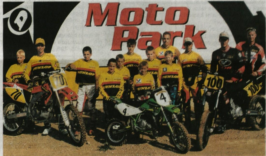
Del ekipe AMD SITAR DUNLOP Racing - tudi letos državni prvaki