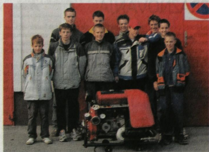
Desetina mladincev po uspešnem zaključku na državnem gasilskem tekmovanju