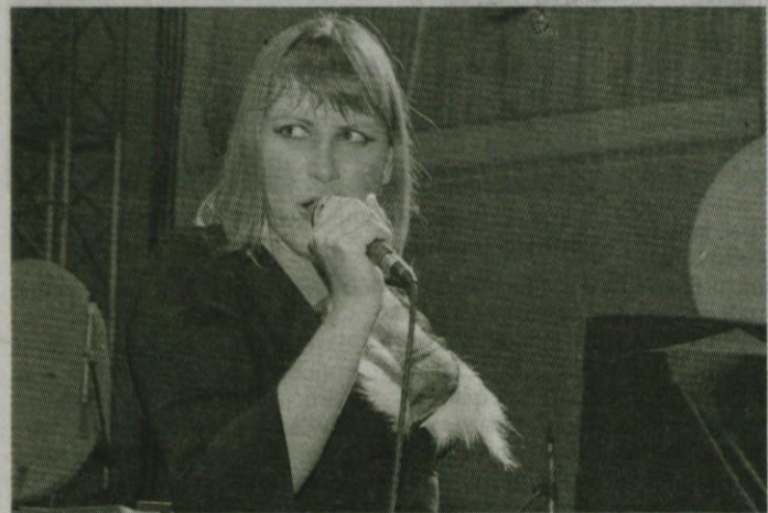
Maja v navalu čustev

Potopisna predavanja tudi ta mesec so, ravno tako tudi filmski večeri, ki so začinjani z nekaj presenečenji, v prihodnjem mesecu pa že lahko pričakujete tudi kakšno bolj zimsko aktivnost, saj sneg že beli gore okrog nas in čas je, da znova nabrusite robnike svojih smuč, sani, desk in drsalk in se pripravite na snežno in ledeno zabavo.