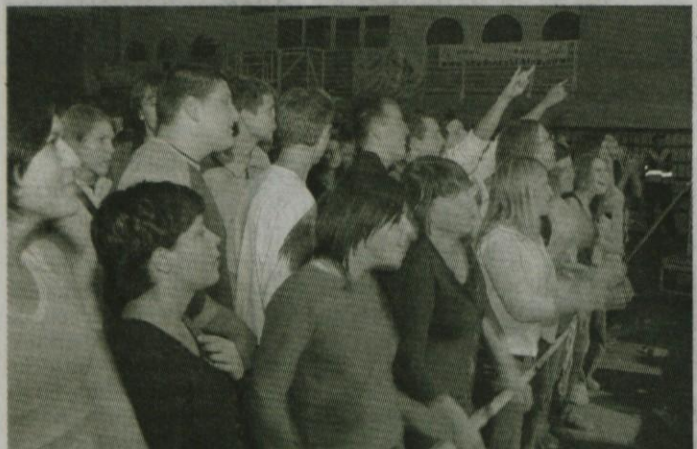
Zabava v Komendi

Mnogi ste se prvi vikend v novembru zbrali v športni dvorani v Komendi in po navdušenju in dobrih odzivih sodeč, ni bilo prav nikomur žal, da je prišel. Obe mladi skupini - Skat in Anavrin sta dokazali, da jih zaslužno uvrščamo med najperspektivnejše glasbene skupine in da je pred njimi svetla prihodnost. Še najbolj so bili obiskovalci razočarani nad zvezdniško zasedbo Tabu, ki po mnenju mnogih ni pokazala vsega, kar zna in po čemer tudi slovi - torej dobrem nastopu, nabitem z energijo in domišljijo. Vseeno pa so bili obiskovalci soglasni, da je bila zabava odlična in da si takšnih ali podobnih želijo še več!