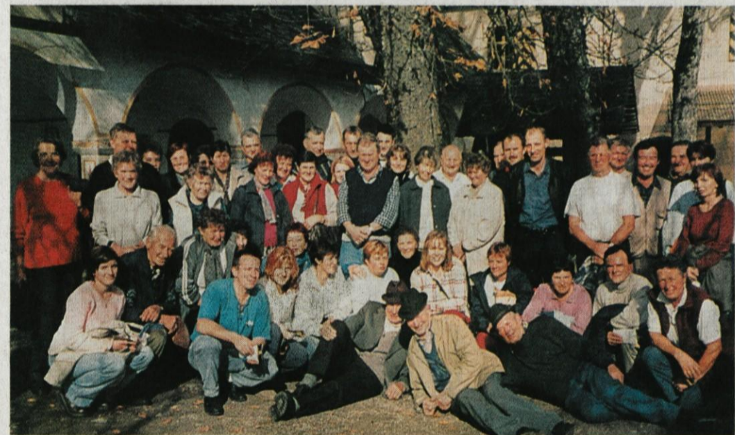
Udeleženci izleta na gradu Ostrovica