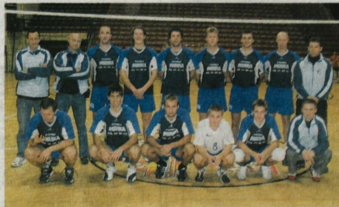
Odbojkarji Calcit Kamnika na gostovanju v Srbiji

V drugi tekmi proti eni najbogatejših evropskih ekip, francoskemu Tourcoingu, pa so Kamničani zaigrali kot prerojeni. Če odmislimo gladko izgubljena prvi in tretji set, so bili Kamničani proti