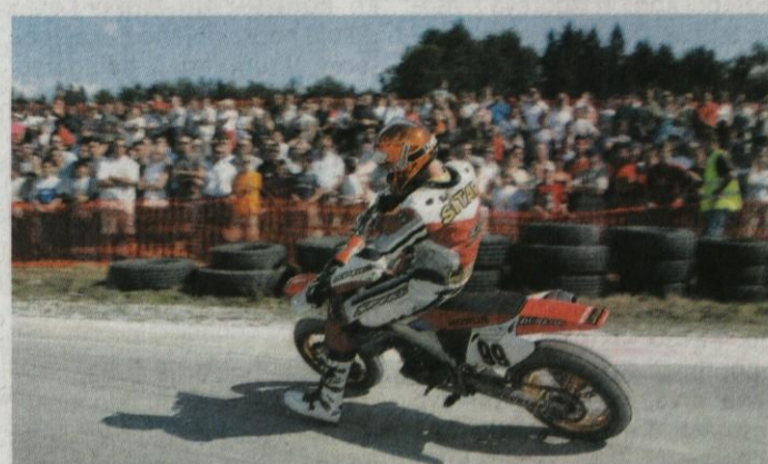
Cestno hitrostna dirka v Kamniku je privabila ogromno gledalcev

Ker nam dirke v razredih supermoto, minimoto in skuter kljub vpisu v koledar državnih dirk z mednarodno udeležbo še ni bilo možno izvesti na načrtovano progi na Brniku, smo se odločili, da jo izpeljemo na progi ob kamniški obvoznici - tik pred domačim pragom SITAR PNEUMATIC CENTRA. V lepem sončnem vremenu je okoli 5000 gledalcev po več kot tridesetih letih v Kamniku ponovno spremljalo dirke v hitrostnem motociklizmu. Dirka je v celoti uspela. Zadovoljni smo bili vsi, organizatorji, gledalci, kot tudi vozniki, ki so bili tokrat deležni velike pozornosti.