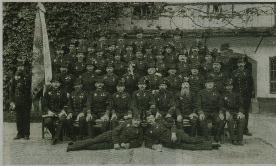
Cesarjeviča Rudolfa vojaško veteransko društvo v Kamniku 18. avgusta 1901.

Vatopnice so v prodaji 14 dni pred prireditvami, ob delavnikih od 10:00 do 12:00 (v upravljalni dvorici), 16.00 do 18:00 (blagajna, glavni vhod z ljubljanske) in uro pred predstavo. tel.: 722 50 50 internet: www.kd-domzale.si