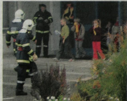
Sektorska vaja reševanja učencev OŠ Nevlje je za vse pozitivna izkušnja.

V zadnjih letih v društvu namerjajo velik poudarek mladini in izobraževanju operativnih članov na področju čina gasilec, saj nihče brez tečaja ne sme gasiti na terenu. Tudi starejši člani se izpopolnjujejo za višje čine in razne specialnos-