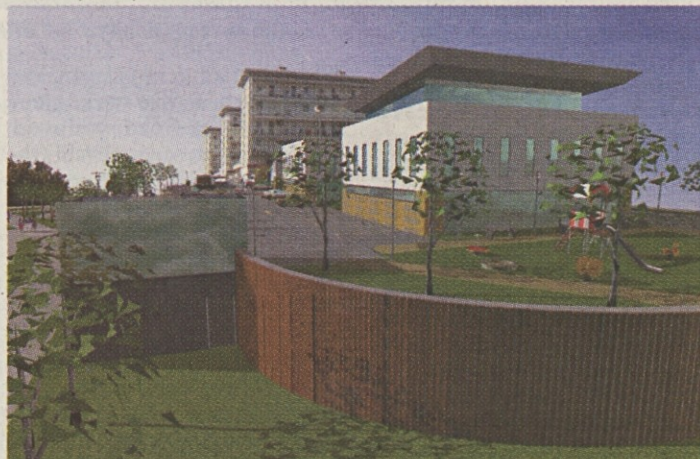
Ozelenitev območja, otroška igrišča in dom krajanov: nove možnosti za izboljšanje kakovosti bivanja in druženja krajanov

Garažna hiša bo v dveh podzemnih etažah obsegala 200 zaprtih garažnih prostorov za osebna vozila. Ob njih bo nekaj manjših garažnih prostorov, namenjenih za shranjevanje koles in motociklov. V parkirni hiši na nivoju Steletove ceste je predvidenih 119 pokritih parkirnih mest, namenjenih dnevnim obiskovalcem Mercatorjeve trgovine in okoliških dejavnosti ter parkirne ploščadi dostopne z Ljubljanske ceste s 70 parkirnimi mesti. Na vseh javnih parkirnih površinah bo zagotovljeno zadostno število parkirnih mest, namenjenih parkiranju invalidnih oseb.