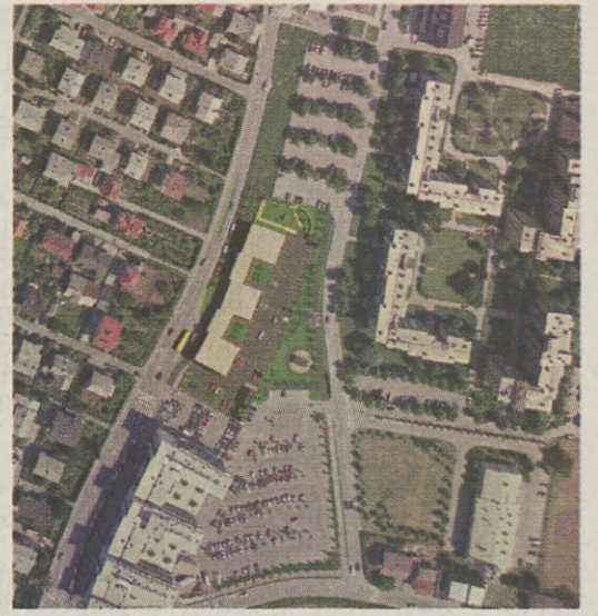
Pogled z zraka. Obstoječa parkirišča za stanovalce Zikove se ohranjajo.

Ob Steletovi cesti bosta urejena hodnik za pešce in kolesarska steza, preostale površine pa bodo parkovno urejene.