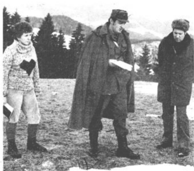
Predstavniki TO KS Mislinja in Paka seznanjajo udeležence pohoda s stanjem na področju SLO in DS pri njih