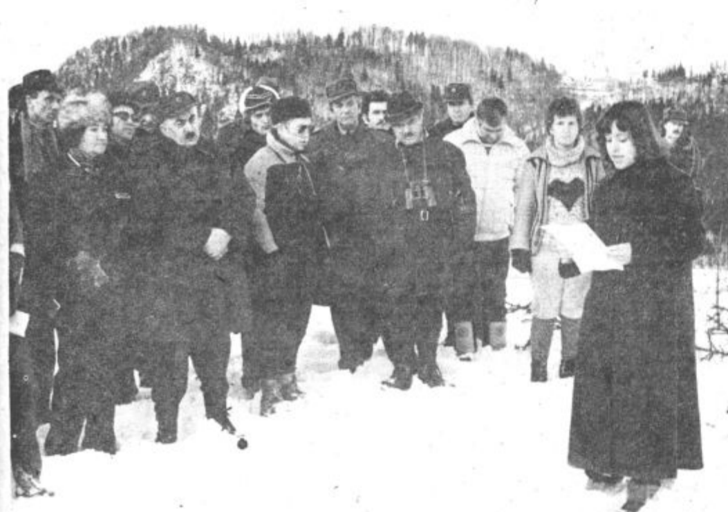
Med pohodom so se poklonili tudi spominu na padle borce legendarne 14. divizije.