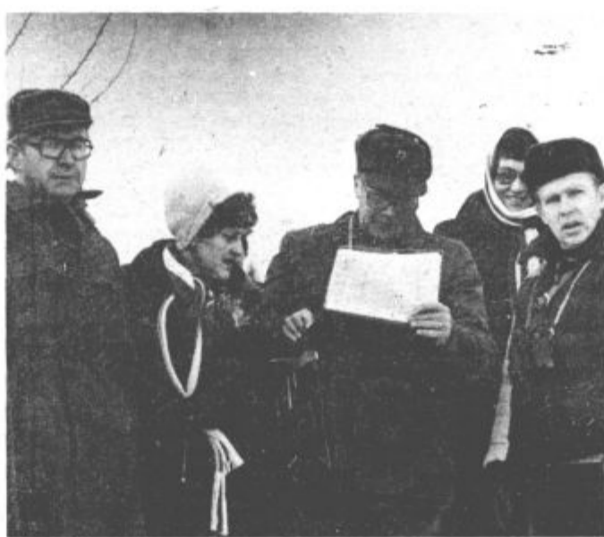
Na delovni točki