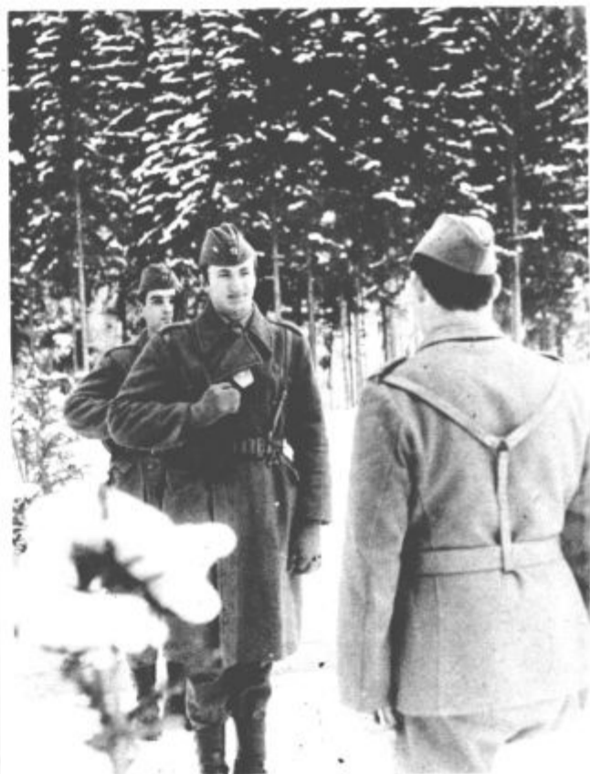
Navodila pred začetkom dolge in naporne poti so še kako pomemben sestavni del vsakdanjih dolžnosti

V ponedeljek bomo proslavili dan oboroženih sil Jugoslavije. Slavje bomo obeležili s številnimi prireditvami, čestitali bomo vojakom, prvim čuvarem pridobitev naše revolucije in nedotakljivosti meja naše samoupravne socialistične domovine. Obljubili jim bomo, da bomo vsi, ki kakorkoli sodelujemo v celovitem spletu obrambnih priprav, skupaj z njimi še vnaprej krepili obrambno sposobnost naše domovine. Skupno bomo neomajni in enotni odločno stopali pa jasno začrtani poti, nadaljevali bomo misel in delo tvorca naše neodvisnosti, velikega vojskovođe tovariša Tita.