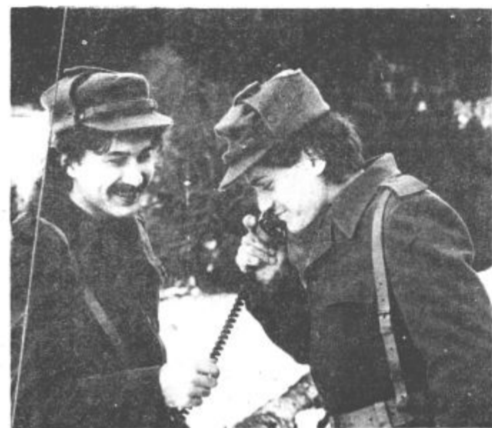
Stalna zveza z dolino