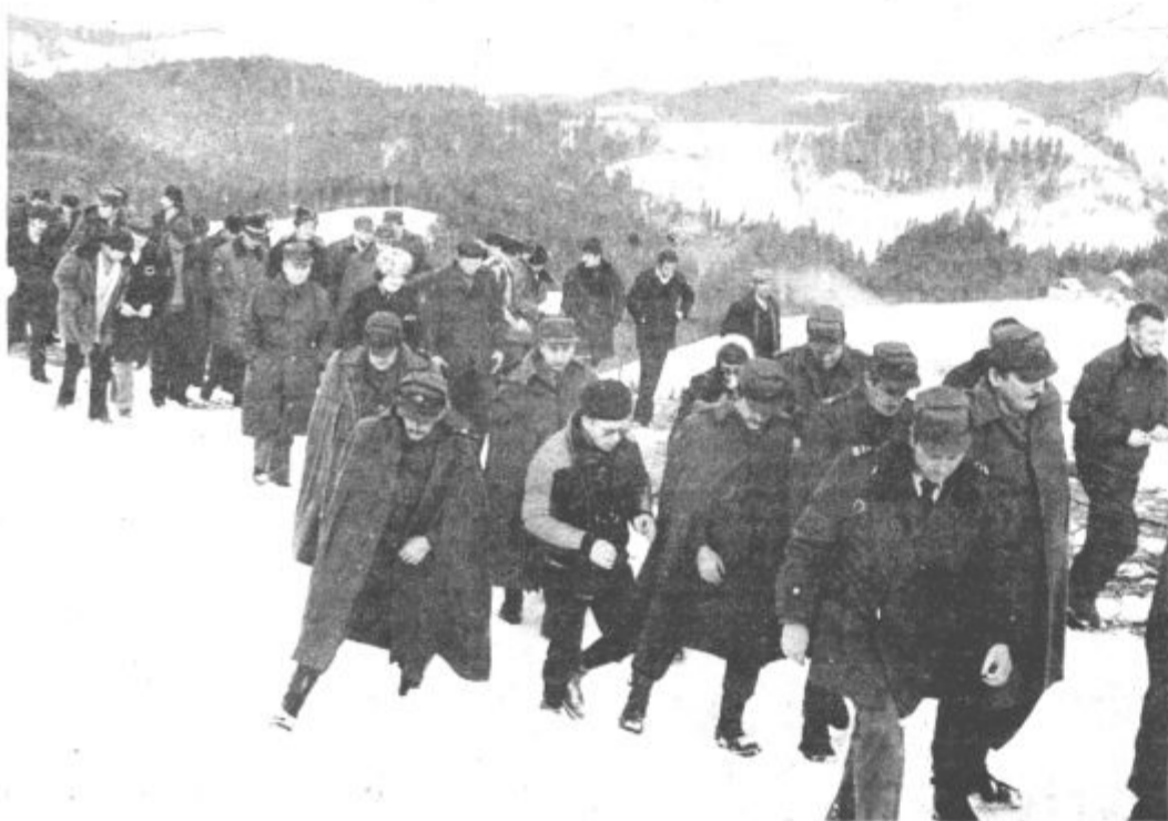
Na poti na delovno točko