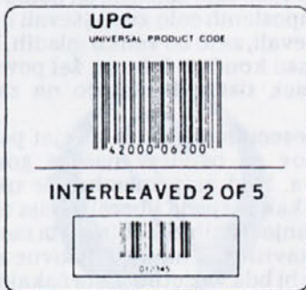
ČRTNA KODA V TOVARNAH

Čitanje črtne kode v trgovinah, skladišču poteka na naslednje načine: kamera z optiko, laser, svinčnik, kodni skener.