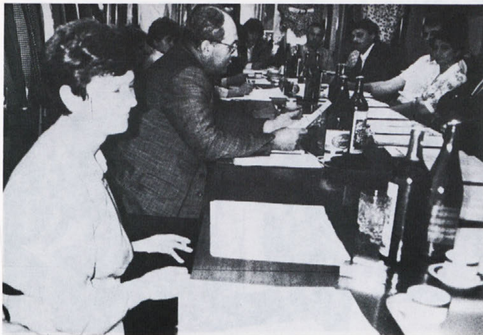
S prve seje delavskega sveta DO.