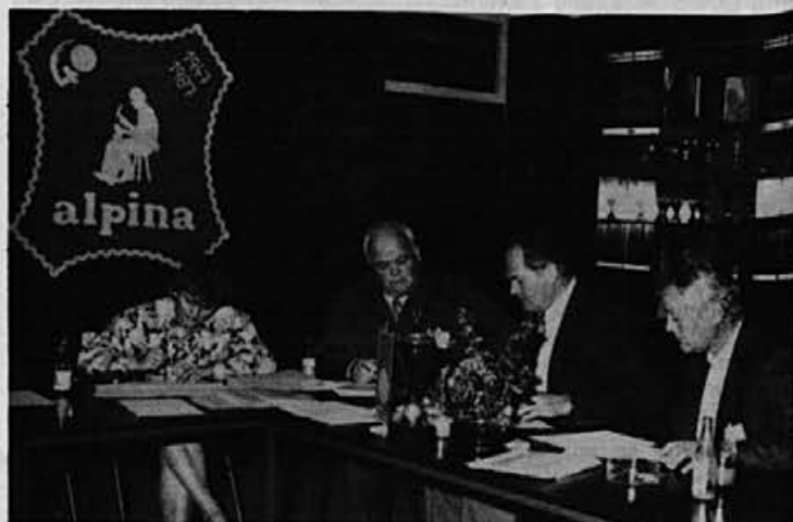
Tekmovalna komisija za ugotavljanje teoretičnih znanj je imela kar veliko dela