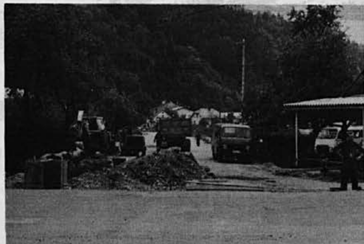
Povezava industrijske ceste s središčem Žirov bo dobrodošla