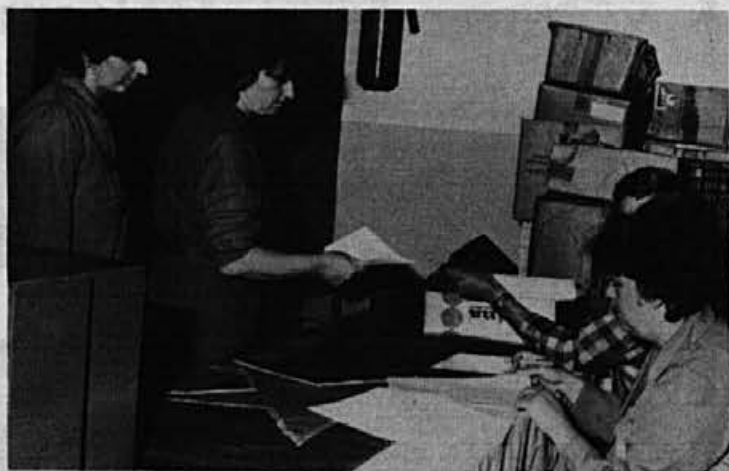
Z referendumu 19. maja 1987

Razpravljali je tudi o ustanovitvi nove prodajalne v Novem Marofu, kjer je v že obstoječem lokalu, brez investicijskih vlaganj, mogoče odpreti prodajalno.