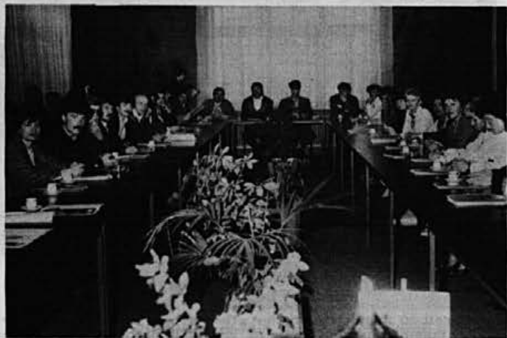
Udeleženci delovnega tekmovanja obutvenih delavcev Slovenije