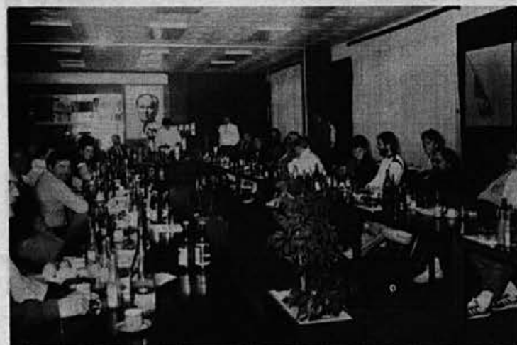
Prejšnji mesec so Alpino obiskali sodelavci firme A&E iz ZRN, ki za to firmo po vsej Nemčiji prodajajo našo obutev