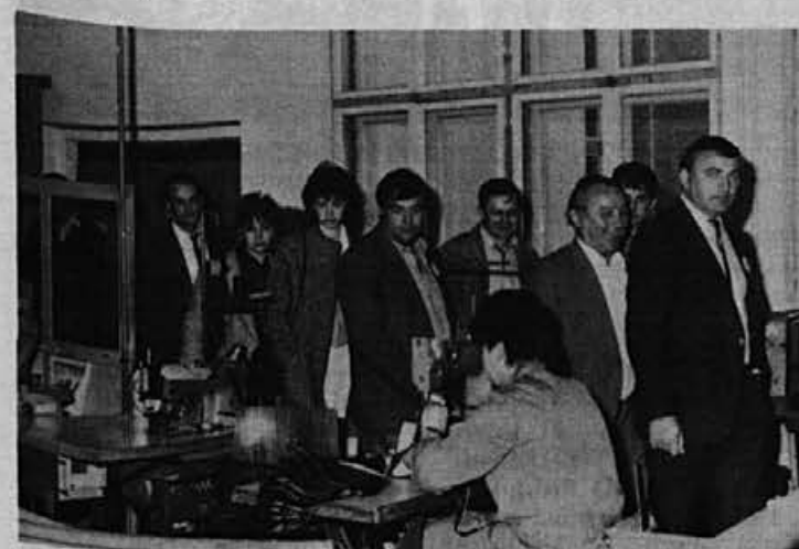
6. junija je Alpino obiskala delegacija iz Srbije, del vlaka bratstva in enotnosti. Gostje iz Aleksandrovca in Smederevske Palanke so si ogledali tudi našo proizvodnjo