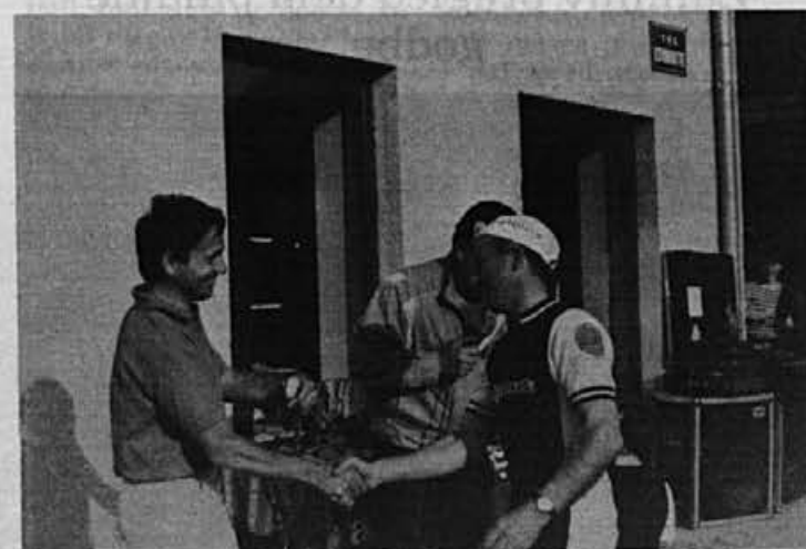
Tradicionalni kronometer Alpine