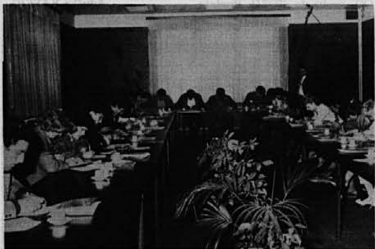
Že prva preizkušnja ni bila od muh; nekaterim je celo delala največ preglavic; to je bila teorija, kjer so tekmovalci odgovarjali na 20 vprašanj, od tega 10 s področja samoupravljanja, 3 z varstva pri delu in 7 s področja, kjer so tekmovali v stroki

23. maja je bilo v Žireh proizvodno-delovno tekmovanje obutvenih delavcev Slovenije, ki se ga je udeležilo 34 tekmovalcev iz sedmih delovnih organizacij čevljarjske industrije.