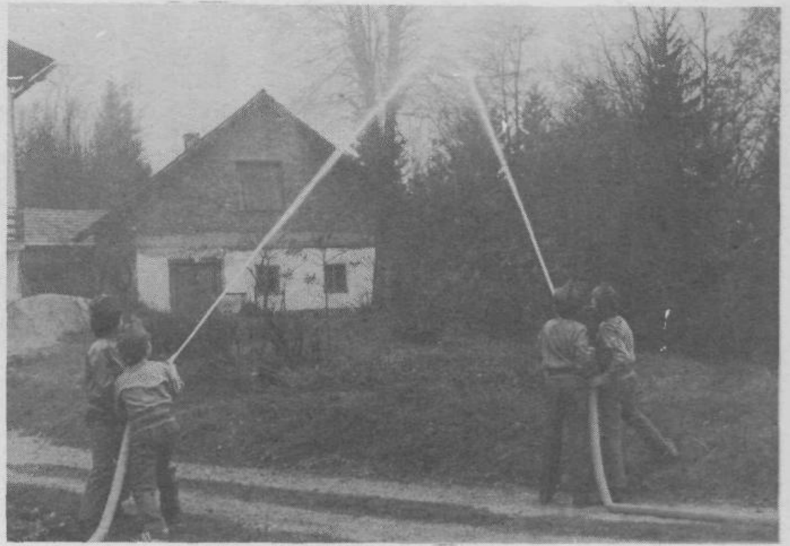
Trenutek, ko je pritekla voda na Plešivici. Na sliki so pionirski GD Žalna