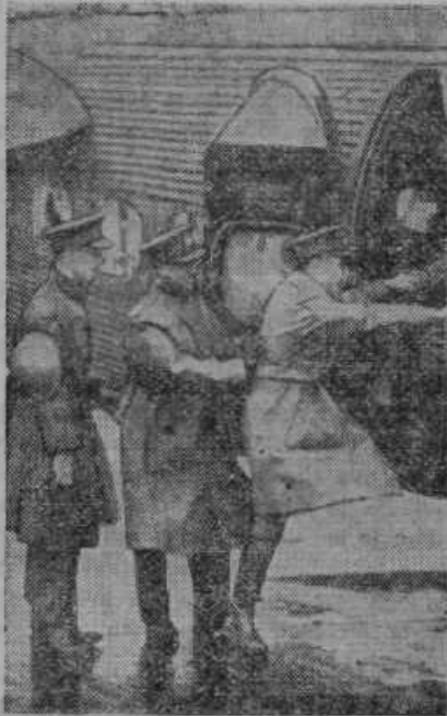
Angleški in ameriški vojni poročevalci v oficirskih uniformah se podajajo v letalu na bojišče

Prosvetna zveza v Mariboru priredi v sredo, 16. novembra, narodno-obrambni tečaj. Vprašanja, ki se bodo razmatrala, so zlasti v sedanjem času zelo pereča. Potreben je v tem oziru stvaren pouk in navodila za to. Tečaj se vrši v Zadrugni gospodarski banki pred- in popoldne. Začetek ob 10. uri. Povabljeni zlasti mladina, da se usposobi za smotreno delo v narodni blagor.