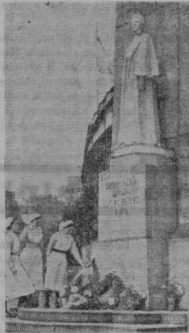
24 let je minulo, odkar so ustrelili Nemci radi volunštva angleško sestro-bolničarko Edito Cavells, pred koje spomenik v Londonu polagajo njene današnje tovarišice vence

Dne 20. oktobra, v petek popoldne, med uro od ene do dveh nas je zopet oklestila huda toča. Neurje je začelo divjati takoj po enih. Bliskalo in grmelo je kakor poleti, vilil se je silen naliiv, podoben onemu v letošnji pomladi, vmes se je pa vsula toča, ki je klestila skoraj iste kraje kakor v pomladi. Začela je tokrat v Virštanju, tolkla je po vsej Imenski gorci, v Imenem in je od tam prešla na Hrvatsko, kjer je je okrog Sv. Ane bilo videti belo kakor od snega. Najbolj so bili tepeni isti posestniki kakor spomladi. Če bi pri tepeni isti posestniki kakor spomladi. Če bi pri