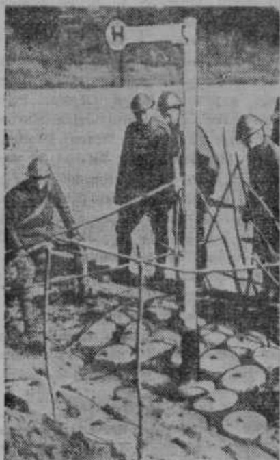
Nemške mine, katere so pobrali Francozi med obema bojnimá črtama na zapadu in jim odvzeli eksplozivno silo ter nevarnost