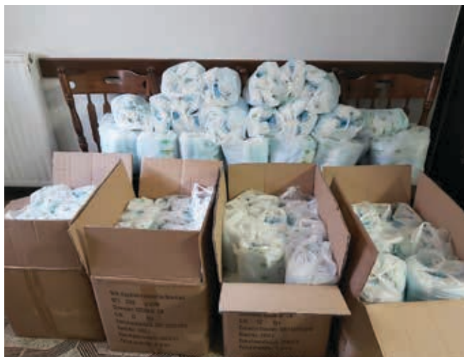
Zaščitne maske čakajo na uporabnike.

Ker ne vemo, koliko časa bo nošenje mask še obvezno in potrebno, izkoristite priložnost, prijavite se na poziv, oddajte spletni obrazec in po prejemu obvestila na vaš e-naslov pridite na prevzem na OOO Vrhnik.