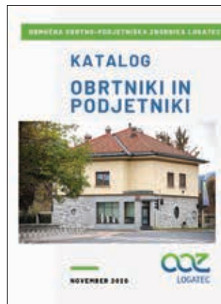
Naslovnica Kataloga članov

Ves čas pa so dežurne številke zbornice za informacije in tolmačenja članom na razpolago vse dni v tednu, 24 ur na dan.