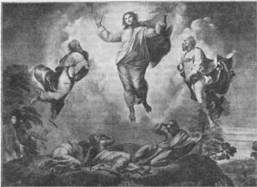
Jezus se spremeni na gori.

20. decembra bo petnajst let, kar je papež Pij X., ki se bliža svetniški glorioli, razglasil vsemu katoliškemu svetu prepomenljivi odlok o pogostnem in vsakdanjem sv. obhajilu ter o zgodnjem obhajilu otrok. Ta 15 letnica ne sme iti kar tiho mimo nas; zato bomo na to še opozorili. Danes samo rečemo: Veliko knjigo bi bilo treba spisati, če bi hoteli samo površno orisati, koliko koristi, sreče, blagoslova je človeštvu že donesel omenjeni obhajilni odlok; koliko mladine je bilo rešene po njem! Don Bosko je rekel nekoč: »Izriniti