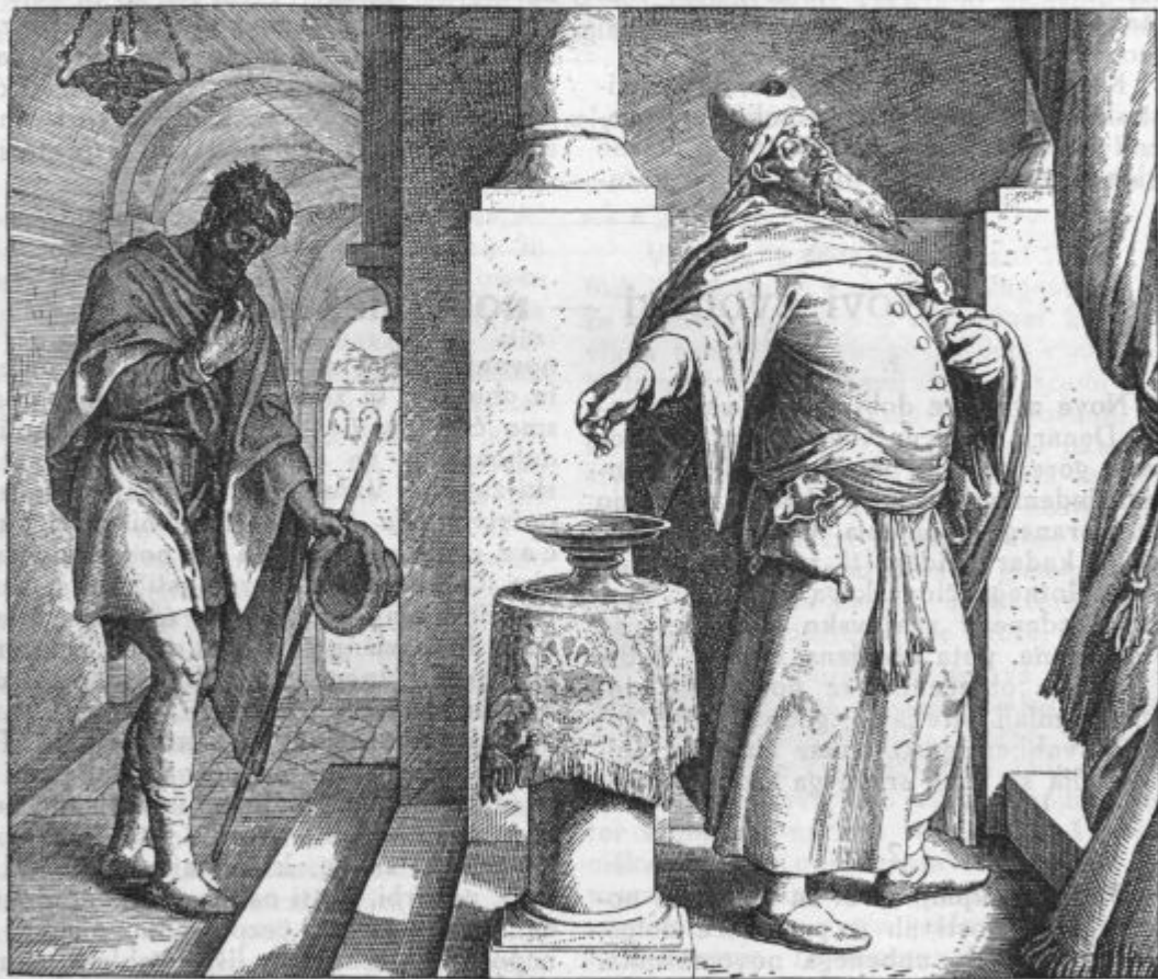
Farizej in cestinar.