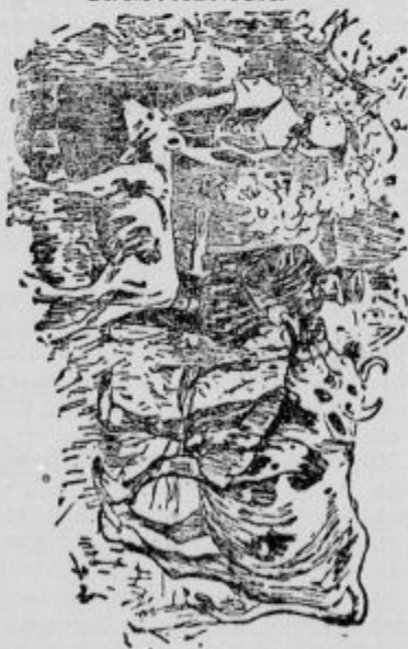
Kje je kupec?