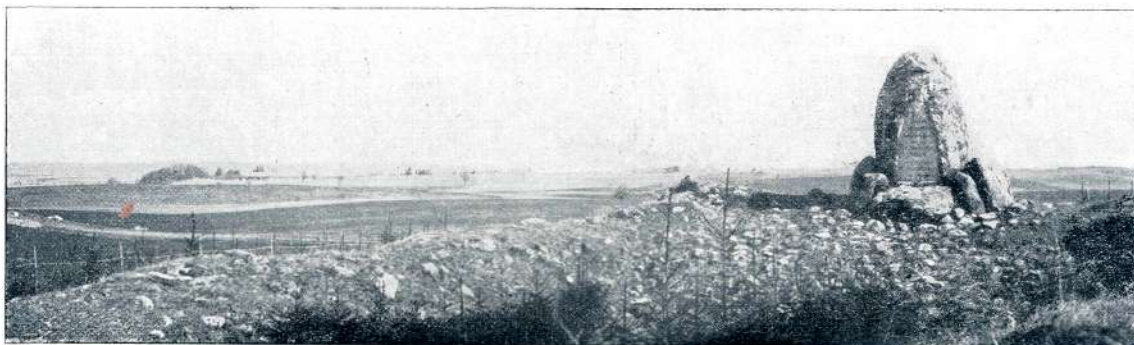
BOJIŠČE PRI TANNENBERGU