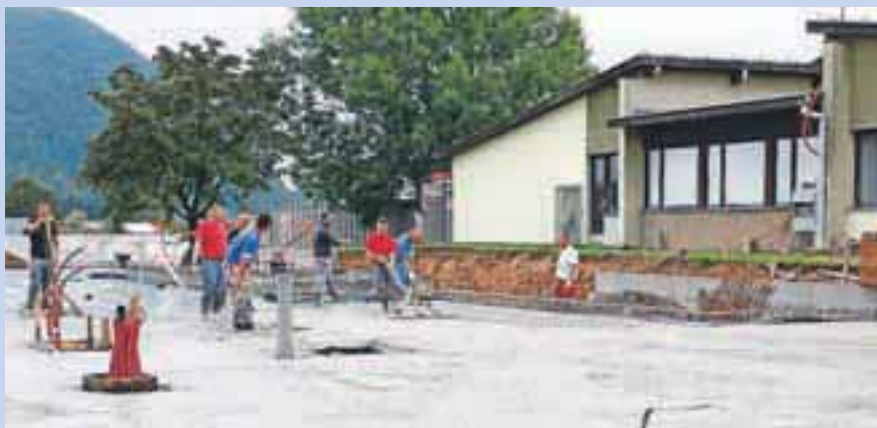
Ob šoli v Pirničah gradijo nov vrtec.