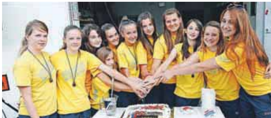
Mlade gasilke so po prihodu z gasilske olimpijade v Franciji pričakali s torto.