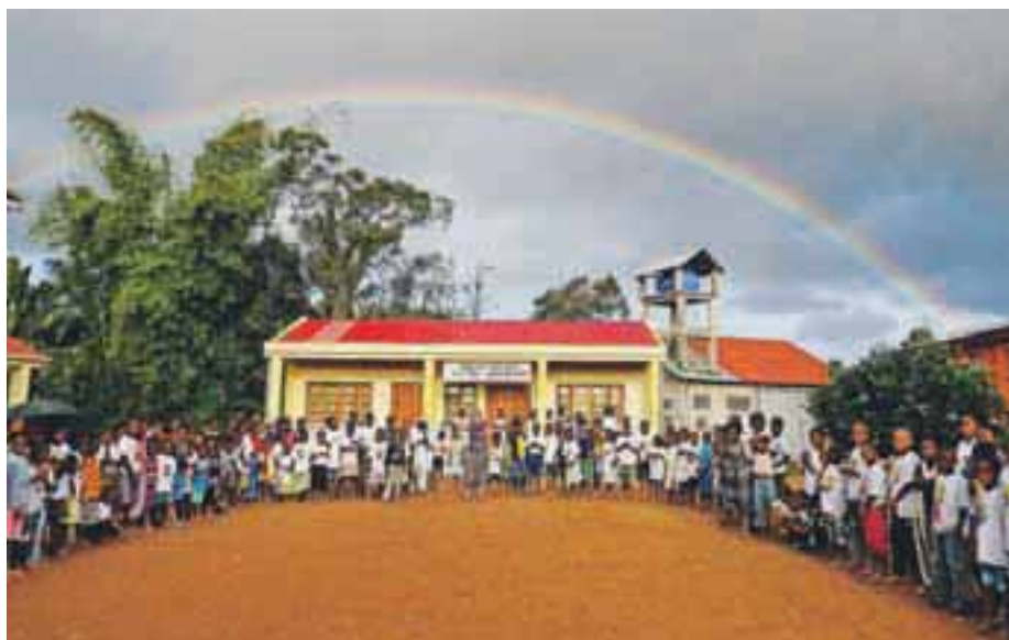
Na oratorijih je sodelovalo od 450 pa do prek 600 otrok.

Mateja Rant, foto: osebni arhiv Tine Kogoj