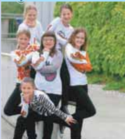
Lokalna novica je kraljica Gorenjski Glas

Na naslovnici: Plesalke Športnega društva Latino