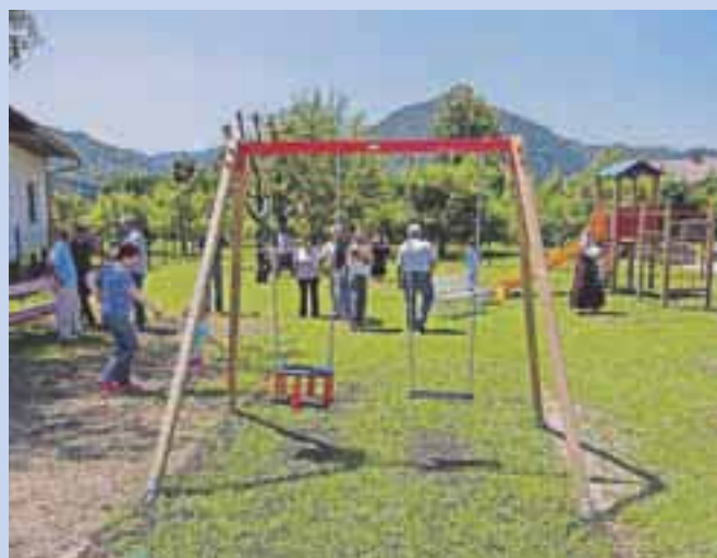
Novo igrišče ob vrtcu na Senici