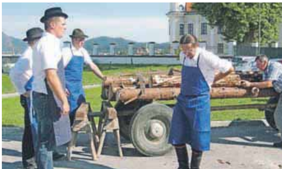
Prikaz obdelave lesa za pripravo celuloze