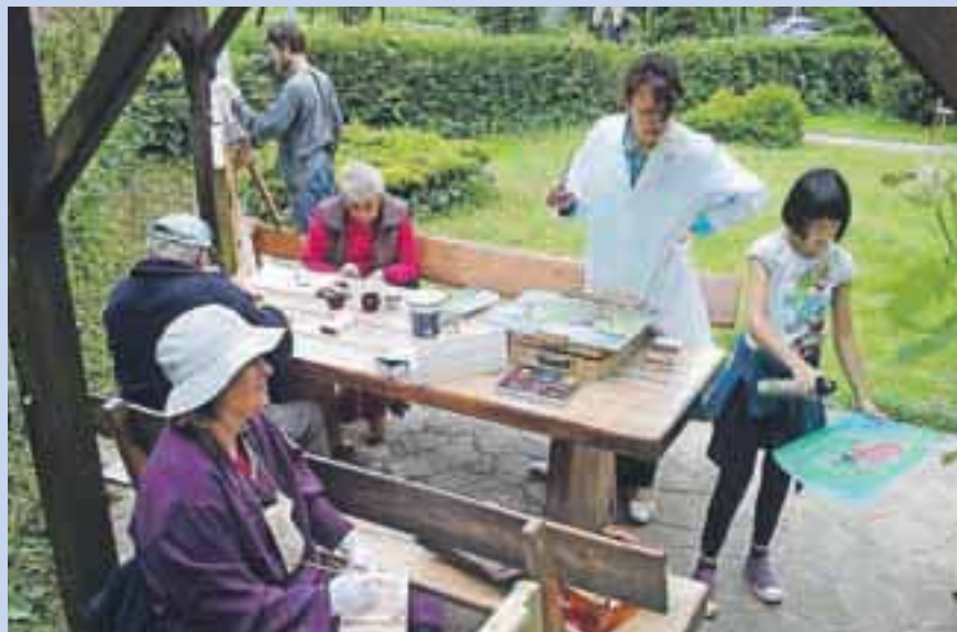
Likovno ustvarjanje članov KUD JaReM v idiličnem ambientu Aljaževine