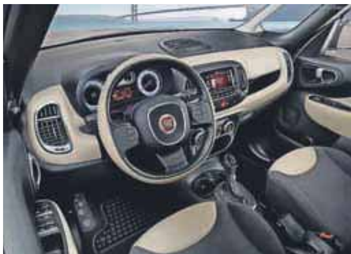
... potem 500L povsem zadostuje vašim potrebam.