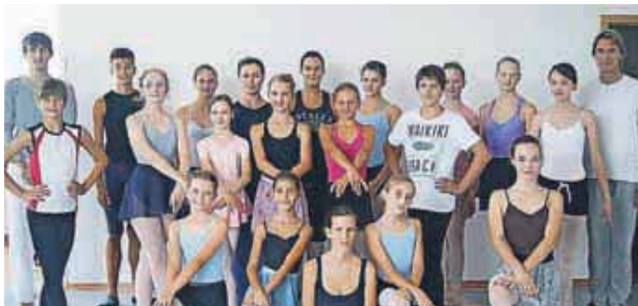
V Pirničah so konec avgusta pripravili poletni baletni seminar, enajsti po vrsti.

V baletni šoli Stevens so konec avgusta pripravili enajsti baletni poletni seminar. Še vedno so pod vtisom uspehov s svetovnega plesnega pokala v Veliki Britaniji.