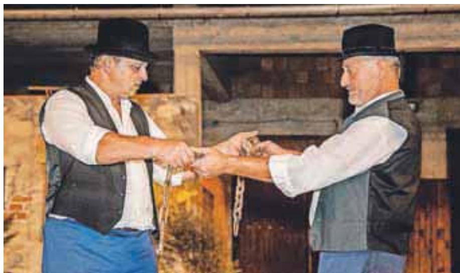
Veriga, za katero se v igri pravadata Marko in Mejač, je prav tista, ki je pred stotimi leti zanelila prepir na Senici.

Od zadnje uprizoritve je minilo sedem let, zato so si gledalci letošnjo prišli ogledat v velikem številu. Medsosedski odnosi znajo biti še danes težava, zato Veriga tudi po stotih letih ostaja zelo aktualna. Peter Košenina