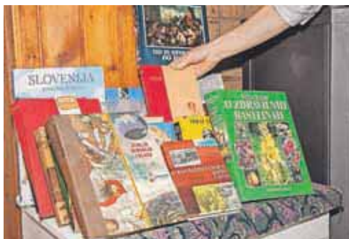
Mini »knjižnica« na Osolniku