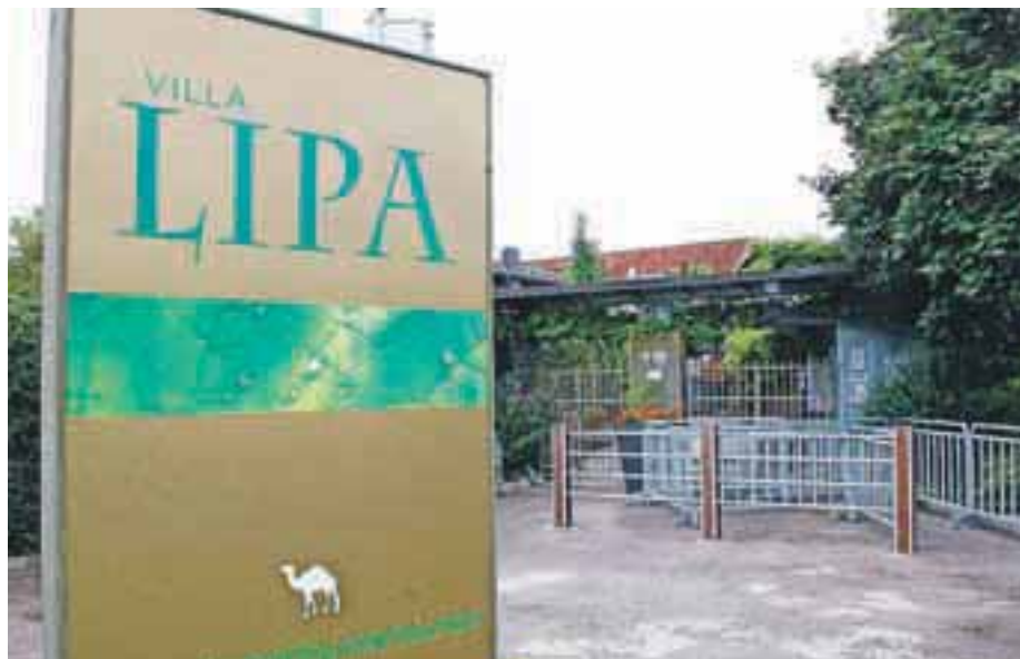
V Lipi v zabavam do jutranjih ur nadaljujejo tudi septembra.