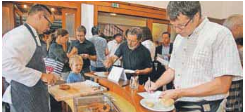
V Sori so letos že deseto leto zapored pripravili ocenjevanje kranjske klobase.