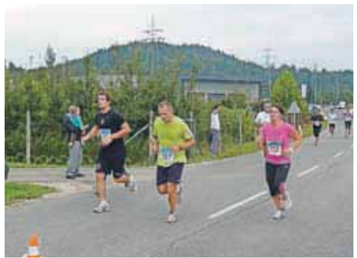
Lani se je na ulicah Medvod zbralo blizu dvesto tekačev in tekačic, letos jih pričakujejo vsaj toliko.

»Ja, trasa proge ostaja ista, krog pa je dolg pet kilometrov. Razlika je v tem, da bo letos moč teči še na dodatni 20-kilometrski razdalji. Tako bo tek organiziran za tiste, ki se bodo želeli preizkušiti v teku na 5 kilometrov, na 10 kilometrov, na 20 kilometrov, dodatno pa smo poskrbeli tudi za najmlajše, saj ob prireditvi pripravljamo tudi vzajemkov tek za otroke, za katerega se bo moč prijavit na dan prireditiv med 15. in 15.20, start tega teka pa bo ob 15.30.«