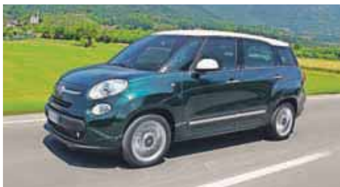
Če ste kot voznik dozoreli ...