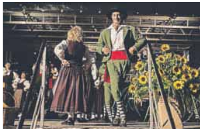
Folklorne skupine iz Slovenije in sosednjih držav so se predstavile na Poskočni špili.