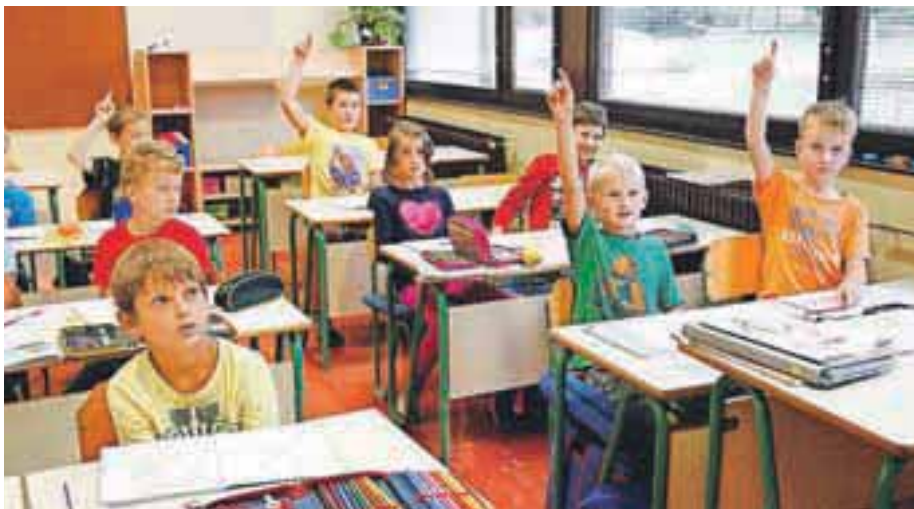
Učenci so znova sedli v šolske klopi.

V osnovno šolo Pirniče je letos vključenih 239 otrok, ki so razporejeni v 12 oddelkov. Od