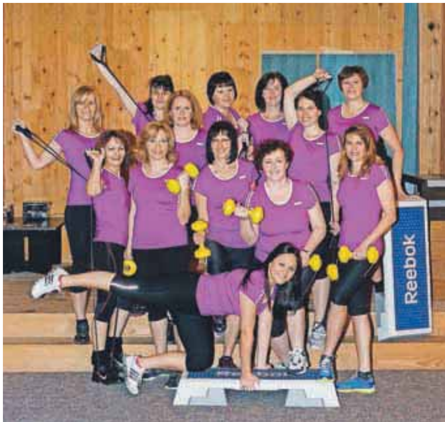
Fotografija z naslovnice biltena, ki so ga izdale ob dvajsetletnici.