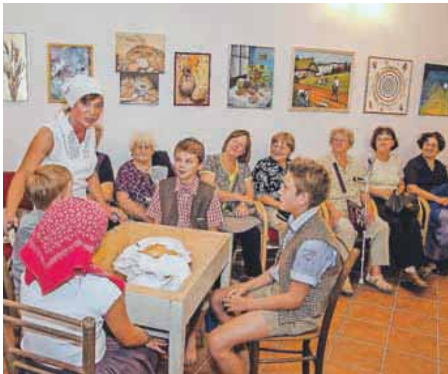
V Domu krajanov Pirniče so minulo soboto odprli razstavo Moj ljubi kruhek.

Likovna sekcija KUD Pirniče je pripravila že tradicionalno likovno in etnografsko razstavo v Domu krajanov Pirniče, ki so jo letos naslovili Moj ljubi kruhek.