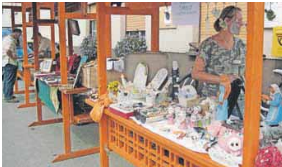
Na semanjem dnevu na Telečjem so se s pridelki in unikatnimi izdelki predstavili številni lokalni ponudniki.