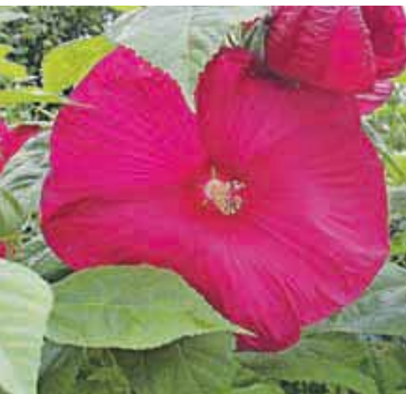
Močvirski hibiskus z ogromnimi cvetovi

Njihovi veliki pisani cvetovi, katerih lepota traja le en dan, nam pričarajo pravo poletno vzdušje. Večina ob besedi hibiskus pomisli na cvet, naslikan na škatlici čaja, ali pa na cvet, ki ga nosijo za ušesi dekleta s Havajev. Toda le malo ljudi ve, da poznamo več vrst hibiskusov, ki lepo uspevajo tudi pri nas.