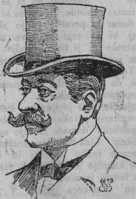
Baron Albert Rothschild †

Kakor smo že zadnjič poročali, umrl je na Dunaju šef bančne hiše baron Albert Rothschild. Pokojnik je spadal med največje bogatine na svetu in je zapustil velikansko premoženje. Mnogo denarja je izdal tudi v