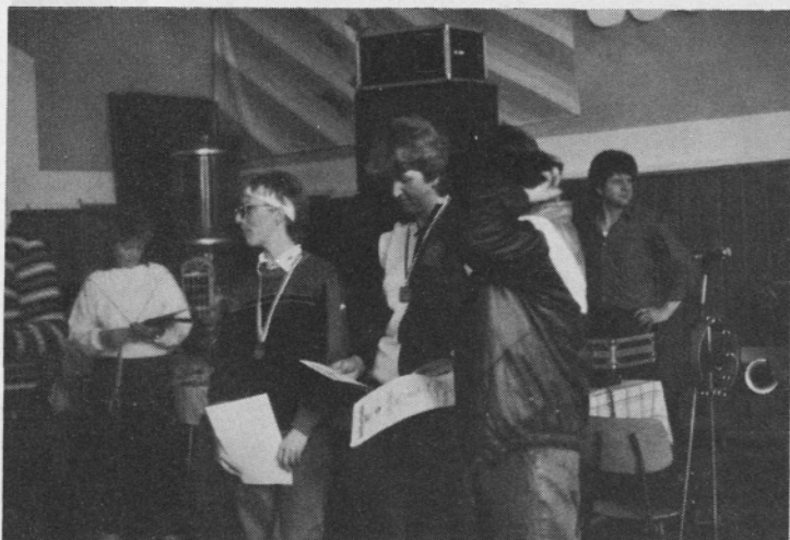
Prve tri v teku na smučeh.