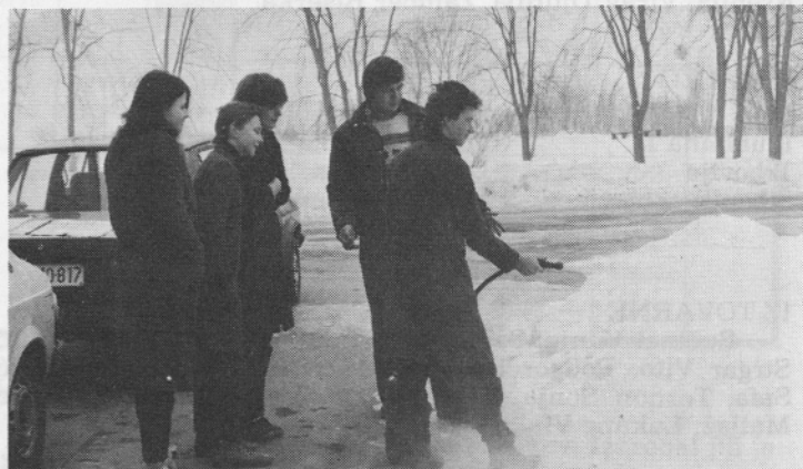
Prikaz delovanja gasilnega aparata in učinek pri gašenju v Benediktu.

Delovni obisk z enakim programom se je nadaljeval v Triu, popoldne pa je Vinko Hafner sodeloval na posvetu sekretarjev OO ZK. Tema razgovora je bila prenova ZK in ZK in Komunistem.