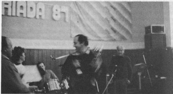
Ekipa Peko: prehodni pokal za skupno zmago v trajno last