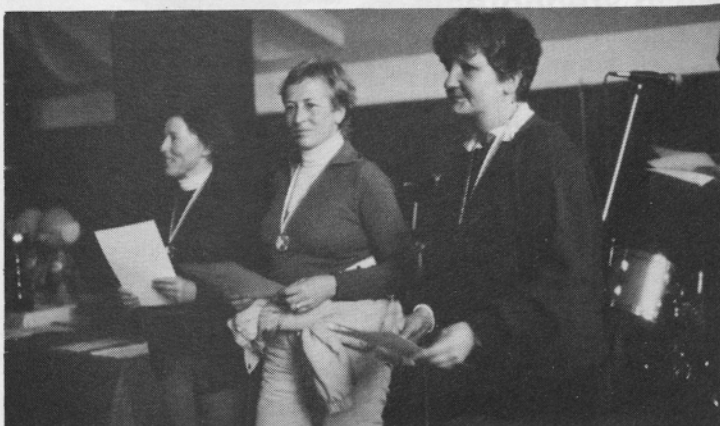
ŠUŠTARIADA: Zmagovalke »tretje« kategorije.