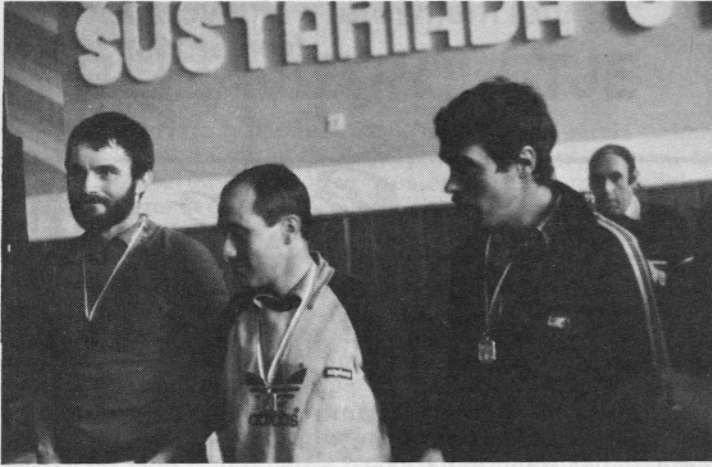
ŠUŠTARIADA: Prvi trije v teku na smučeh.