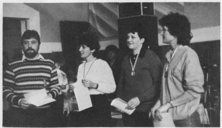
ŠUŠTARIADA: Zmagovalke srednje kategorije.