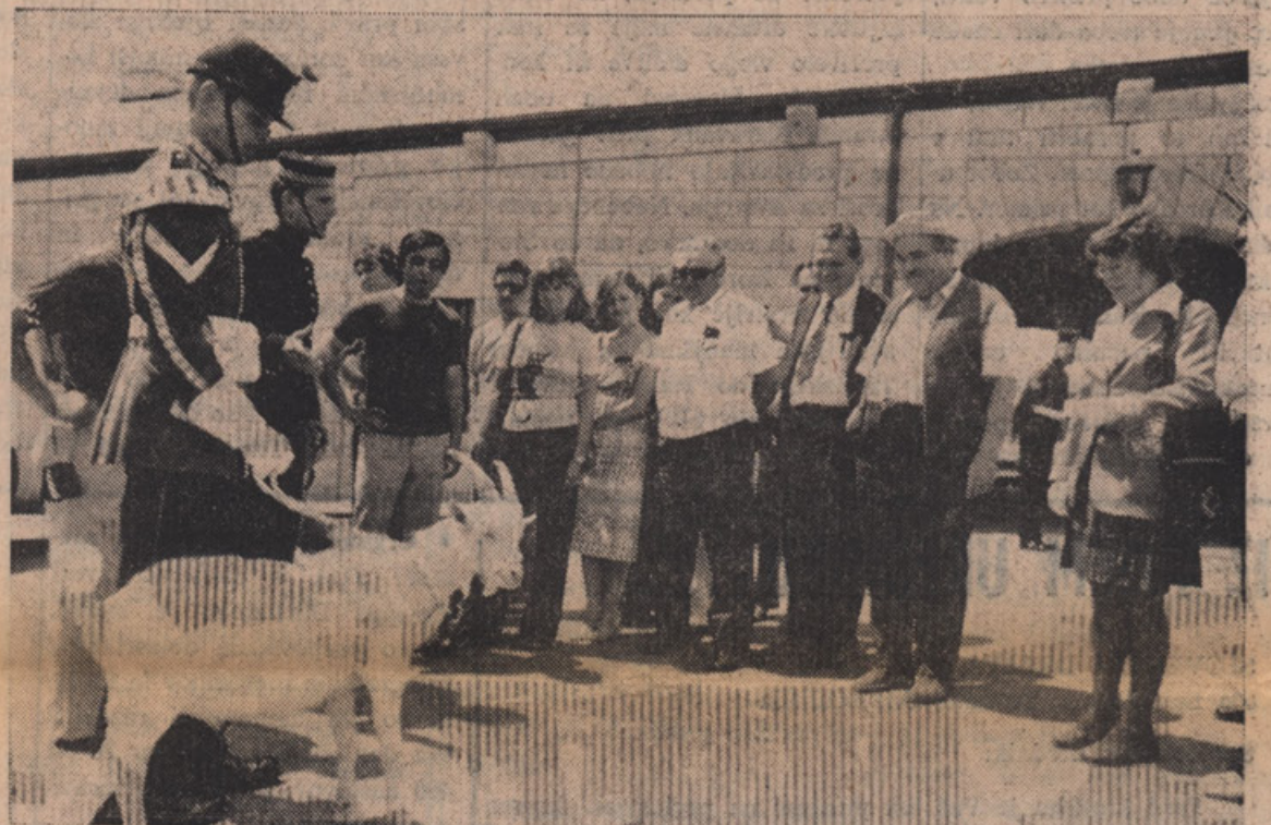
Na obisku v Old Fort Henry v Kingstonu.