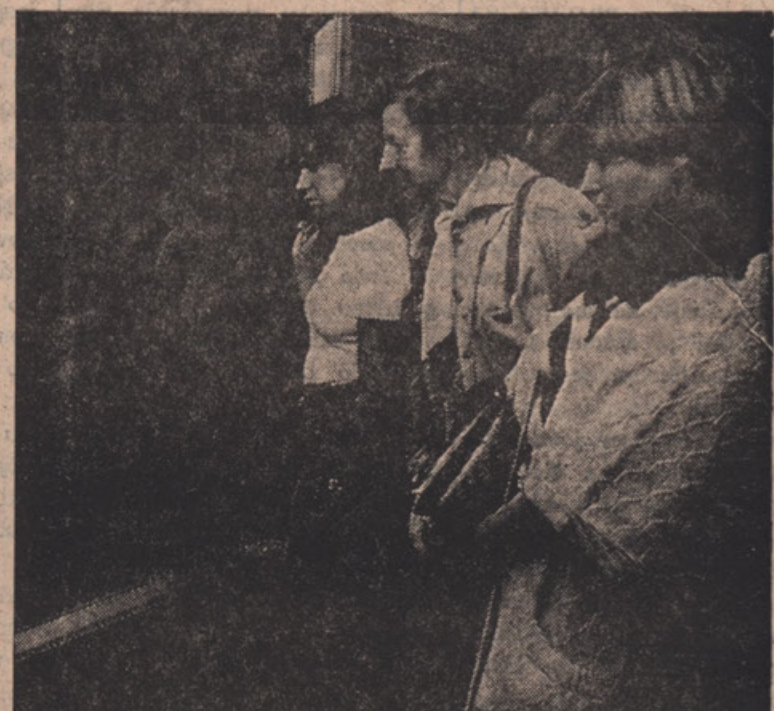
Uredniki so si ogledali Hershey's tovarno čokolade v Smith Fallsu.