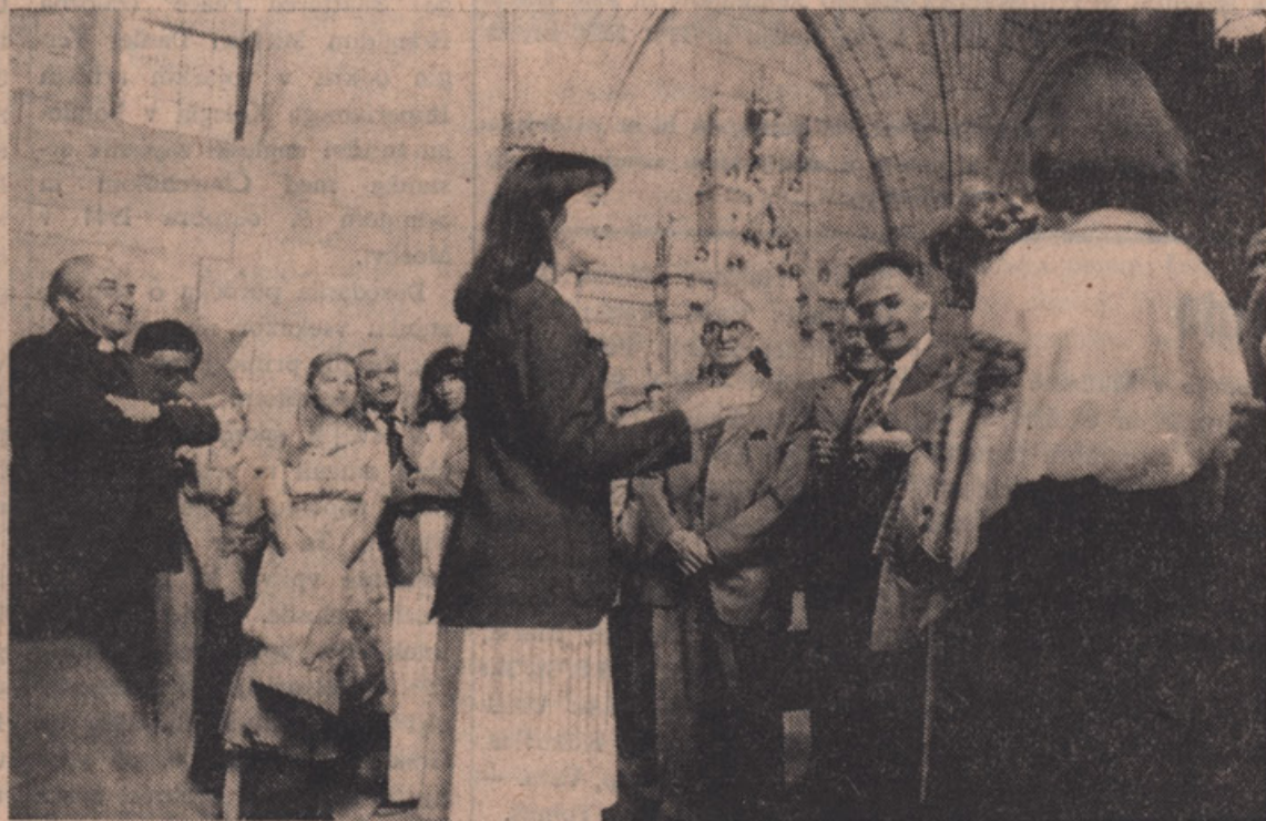
Uredniki etničnih listov si ogledujejo izdelavo notranjosti federalnega parlamenta v Ottavi.

Taken from the song Ontario, these words describe our province. This was proven well on our annual Ethnic Press Tour sponsored by the Ministry of Industry and Tourism. The tour took us from the country's capitol with its parliament buildings and regal residential areas. We travelled on to several industries, such as Hershey's Chocolate Company and a Spice Factory, the Lithuanian Art Centre run by an elderly couple concerned with preserving their