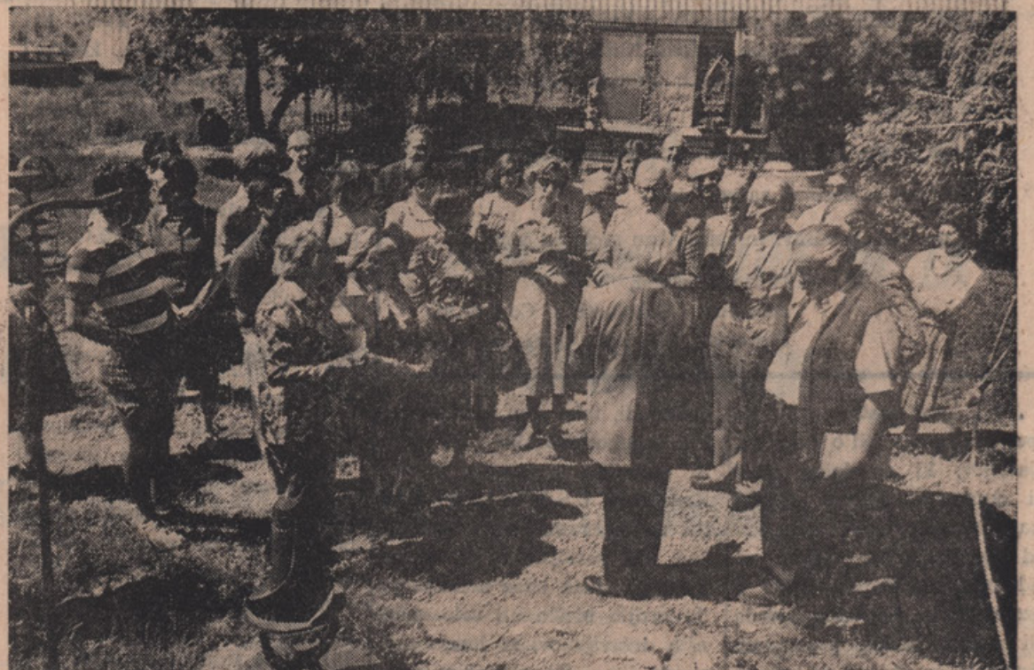
Na obisku v litvanskem umetniškem centru blizu Kingstona.