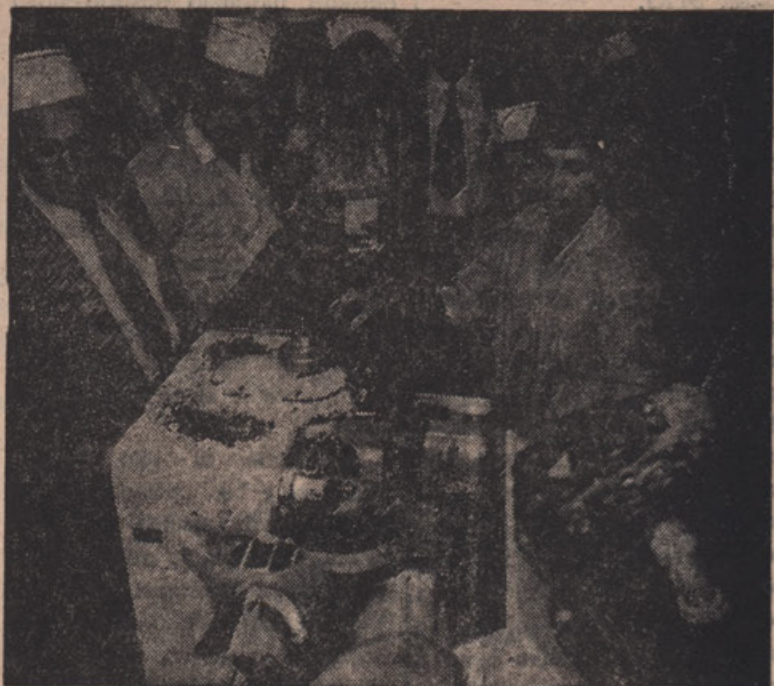
Ogled tovarne dišav blizu Belvilla.

Ni bil samo glasbenik, napisal je tudi več komičnih prizo-