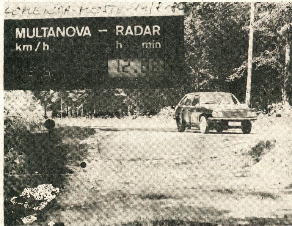
126 km na uro in še več na cesti Komenda–Moste.

Največ kršilcev reda in miru je bilo zaposlenih – 335. Tistih, katerim pravimo, da delajo pri »sončni upravi« ali na »inštitutu za raziskavo delavca«, v resnici pa povzročajo delo miličnikom in sodniku za prekrške, je bilo v preteklem letu 51.