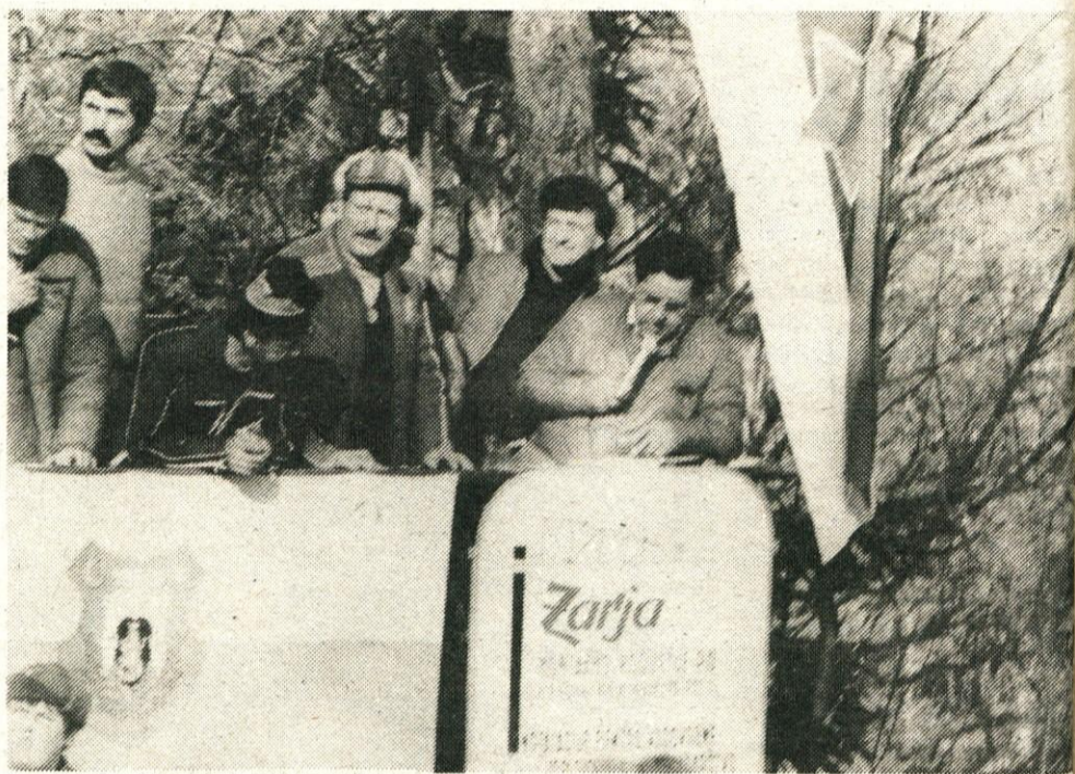
Sodniški zbor na stolpu ob skalalnici