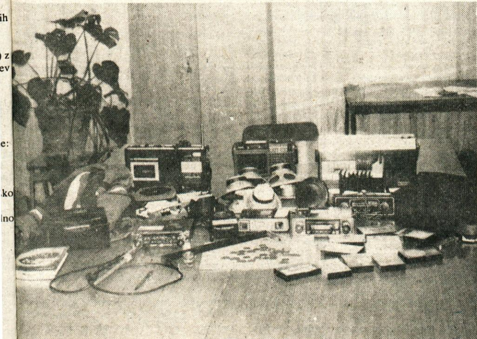
»Zbirke«, ki jo je nabral B. Ž. na svojih krivih potih, o čemer smo pisali v zadnji številki našega lista.