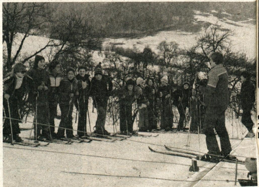
Okrog 150 petošolcev iz osnovne šole Fran Albreht je letošnjo zimsko šolo v naravi preživel kar na tunjiških smučiščih. Dosti ceneje je bilo, kot v večjih smučarskih centrih, kjer je bilo potrebno plačati tudi penzion. Nasmučali so se brez nezgod, hrano in prevoz so imeli zagotovljen, pozno popoldne pa so se tudi vrnili v topel dom. Skratka, večina otrok je izrazilo zadovoljstvo, saj v vrsti zavlečnic ni bilo potrebno čakati tako dolgo, kot na znanih smučiščih. Pomembno je, da so se mnogi tokrat naučili smučati, drugi pa so znanje smučarskih veščin poglabljali.