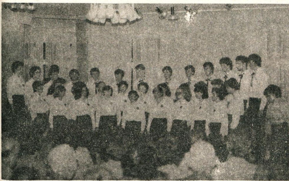
Pevci Mešanega študentskega pevskega zbora na svojem prvem samostojnem koncertu

● Uspešno delo kamniškega mešanega pevskega študentskega zbora