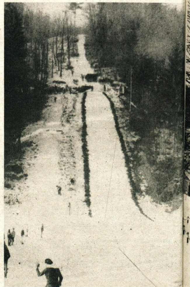
Skakalnica je bila dobro pripravljena za jubilejno prireditev ob 50-letnici

Mlajši cicibani: Balantič Tomaz 107,9 točk.