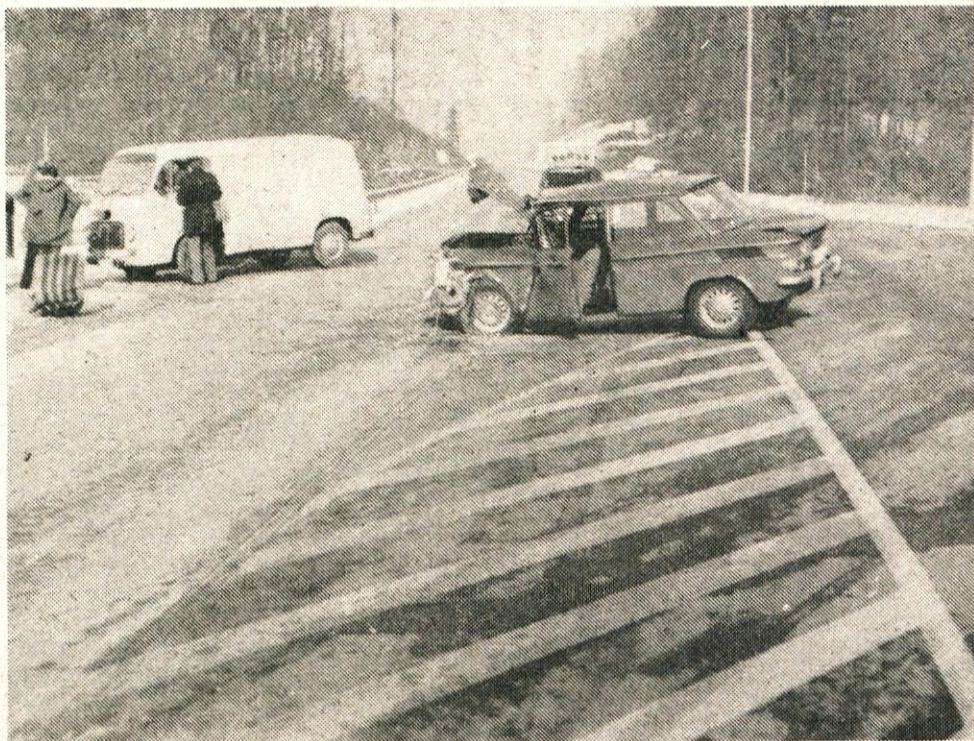
Posledica izsiljevanja prednosti s ceste, ki vodi iz Volčjega potoka na obvozno cesto.

V ogromnem porastu je mladoletniško prestopništvo na po-