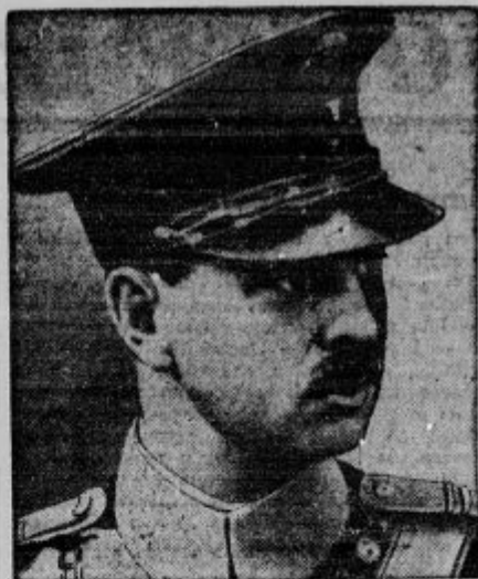
Romunski kralj Karol, ki je moral Sovjetom odstopiti Besarabijo in Bukovino in nekaj oporišč ob Črnem morju.