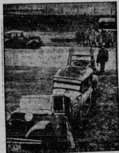
Berikada iz avtomobilov in vojaške straže na Great Roadu pri Londonu.