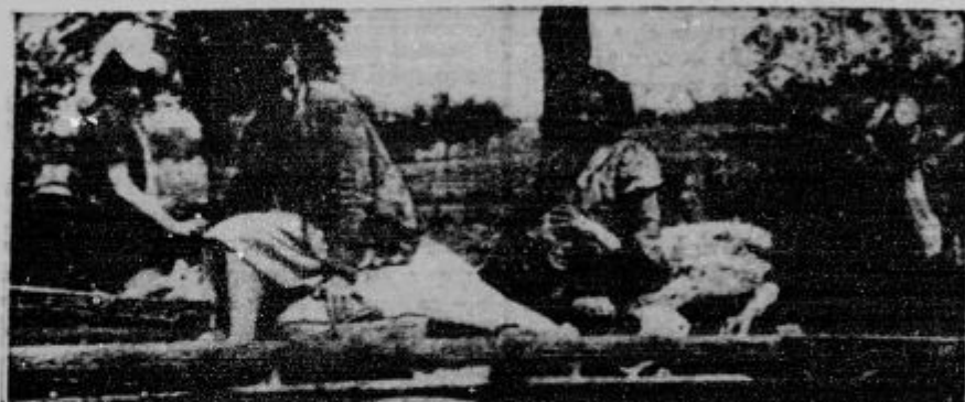
Francoški begunci se vračajo na svoje domove.