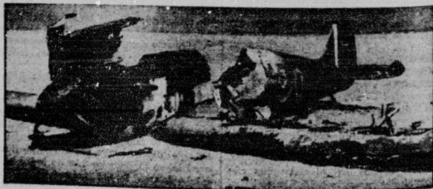
Angleški bombnik, ki so ga Italijani sestrelili v Libiji.