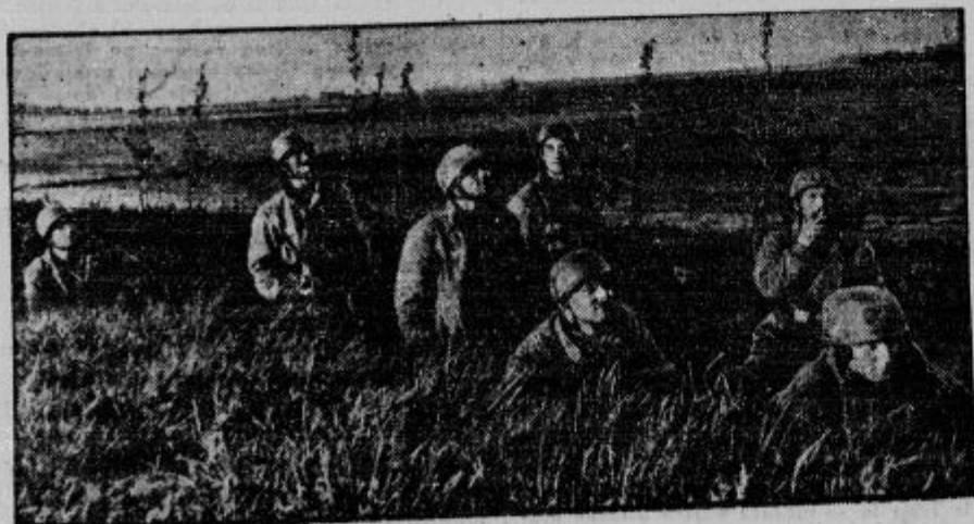
Nemški pehalci so se spustili na sovražne ozemlje in sedaj si ogledujejo pokrajinno, po kateri bodo prodirali.