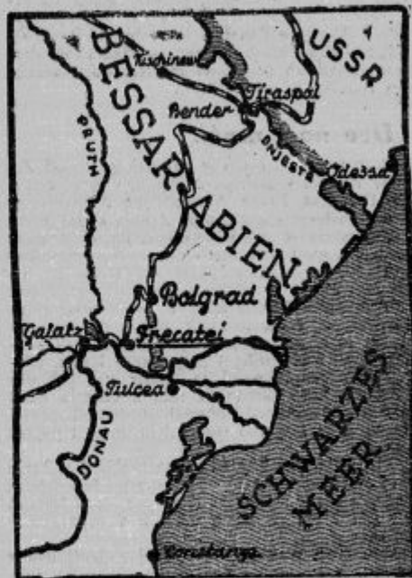
Zemljevid Besarabije, katero je zasedla Sovjetija.