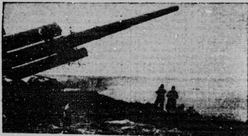
Nemški protiletalski topovi na brečje Rokavskega preliva.