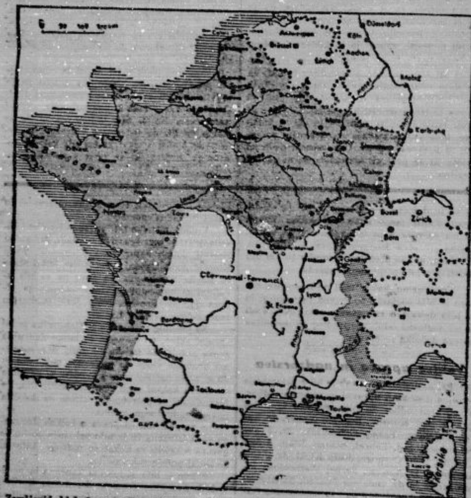
Zemljevid, ki kaže novo Francijo po sklenitvi premirja v Compiègne. Pikčasto označen del na jugovzhodu so morali Francozi po pogodbi z Italijo demilitarizirati. Sredi r.ve Francije nova njena prestolnica Clermont-Ferrand.

Nato se je maršal Petain dotaknil bojev v Flandriji, ob Aisni in ob Sommi ter dejal: »V nekaj dneh je sovražnik prebil naše postojanke in zavzel velji del francoskega ozemlja. Število beguncev je bilo neverjetno veliko: osem milijonov Francozov in poldrug milijon Belgijcev je spravilo v zmedo vse naše zaledje. Od 15. junija dalje je sovražnik prekoračil Loire ter se vrgel na ostali del Francije. Pod takimi okolištnimi je moral prenehati vsak oborožen odpor. Francoska vlada je imela na razpolago dvoje: ali naj ostane na svojem mestu, ali pa gre čez morje. Toda vlada se je odločila ostati v Franciji, da bi ohranila slovo francoskega naroda. Pod temi okolištnimi je bila naša dolžnost sprejeti mirovne pogoje. Premirje je sklenjeno, boj je končan. Na ta dan, dan žalosti, je naša zvestava vendar visoko povzdignjena.«