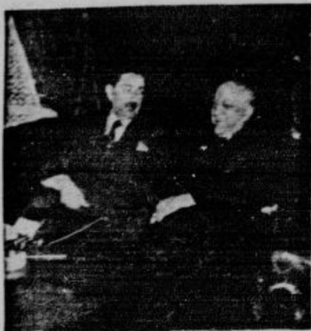
Dr. Korošec se po zapiseh razgovarja v kabinetu predsednika vlade z Dragišo Cvetkovićem.