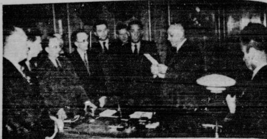
Dr. Korošec bere kot novi prosvetni minister izjavo o smernicah prosvetne politike.