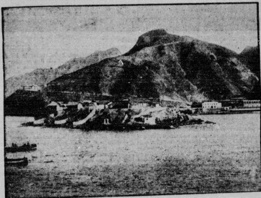
Angleška trdnjava Aden na jugozahodnem koncu Arabije ob morski poti iz Rdečega morja v Indijski ocean. Italijanski aeroplani so že večkrat bombardirali to znamenito trdnjavo.