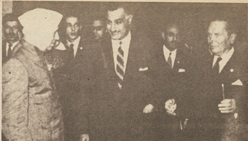
Trije tvorci politike nevrščenih: Nehn, Naser in predsednik Tito, fotografirani ob prvi konferenci nevrščenih v Beogradu leta 1961. Letošnja, peta konferenca bo nedvomno učinkovito nadaljevanje uveljavljanja nevrščenih v svetovni politiki.