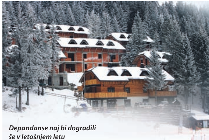
Depandanse naj bi dogradili še v letošnjem letu

Podjetje Sicom Invest je postalo z dokapitalizacijo, ki je obstoječi delničarji niso izkoristili, 76,6-odstotni lastnik Golt.