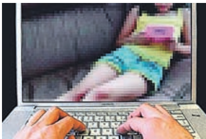
Kriminalisti so preiskovali spolne zlorabe otrok.

Kriminalisti so po celi državi izvedli 15 hišnih preiskav, v katerih so iskali dokaze povezane s spolnimi zlorabami otrok ter razširjanjem in posedovanjem posnetkov zlorab.