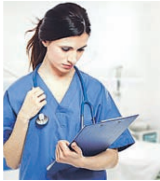
Medicinske sestre so opozorile, da ne bodo več zadovoljne z drobtinicami.

Meddržavno sodišče v Haagu je začelo obravnavo tožbe Ukrajine proti Rusiji. V njej Kijev obtožuje Moskvo nezakonite priključitve Krima in podpore terorističnim dejanjem na vzhodu države.