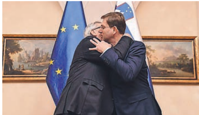
V Ljubljani sta se srečala premier Cerar in predsednik Evropske komisije Jean-Claude Juncker.

Na obisk v Slovenijo je prišel predsednik Evropske komisije Jean-Claude Juncker. Po srečanju s premierjem Mirom Cerarjem je odgovoril tudi na vprašanje v zvezi z zaščito terana in dejal, da bodo v komisiji preverili