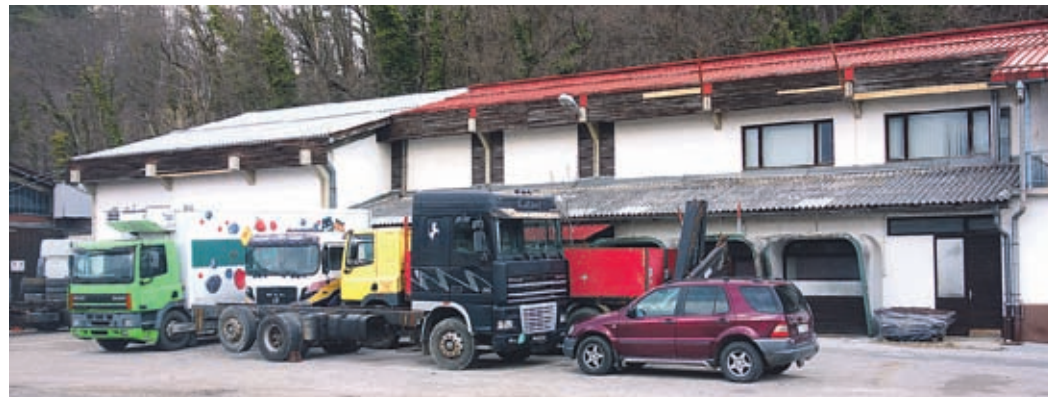
V lokalni skupnosti so odgovorne v sistemu Mercator pozvali k ureditvi objektov in dejavnosti v njih.