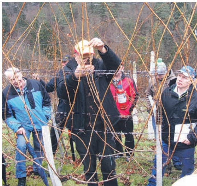
Izkušnje pridobivajo tudi na terenu.

vasi ob prazniku Občine Šmartno ob Paki, se s člani šmarškega turističnega društva udeležili sejma Turizem in prosti čas v Ljubljani ter se odzvali povabilu za sodelovanje na gospodarstvenem krstu vina v šestih zidanicah.