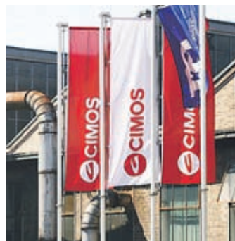
Predstavniki SDH in DUTB na seji o problematiki Cimos niso bili.

Na seji o problematiki Cimos so člani komisije Državnega zbora za nadzor javnih financ označili odsotnost povabljenih predstavnikov SDH in DUTB za nedopusten in sejo do zagotovitve njihove navzočnosti prekinili.