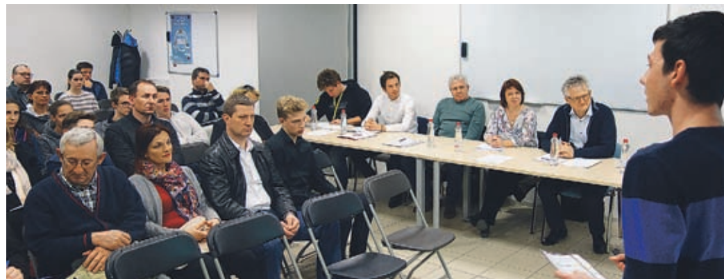
S predstavitve raziskovalnih nalog v prostorih Saša inkubatorja v Velenju

Učenci osnovnih šol in srednješolci so tokrat izdelali 53 razi-