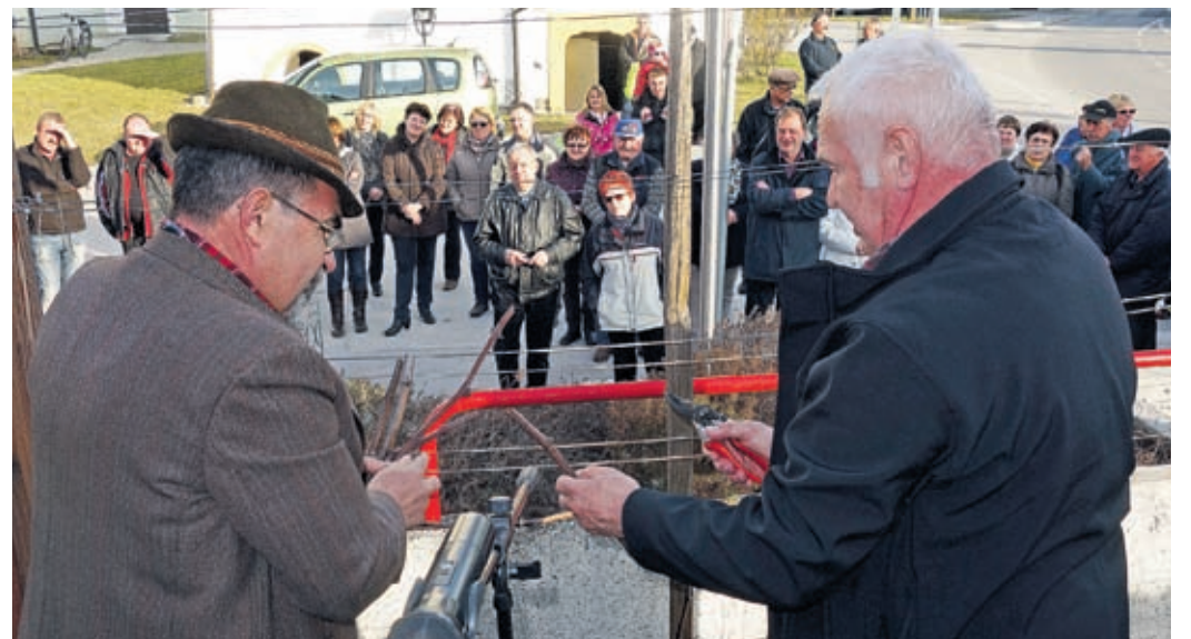
Rez potomke najstarejše vinske trte na svetlo se je v občini Šmartno ob Paki dobro prijelo.