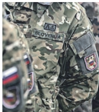
Medresorska delovna skupina bo skušala popularizirati poklica vojaka in policista ter dvigniti nacionalno zavest.

Ministrstva za izobraževanje, notranje zadeve in obrambo so sklenila, da bodo ustanovila medresorsko delovno skupino, katere cilj bo z nacionalno strategijo komuniciranja popularizirati poklica vojaka in policista ter dvigniti nacionalno zavest.