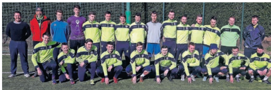
Na pripravah v Piranu so odigrali prijateljsko tekmo, ki daje upanje, da bodo rezultati v nadaljevanju prvenstva boljši.