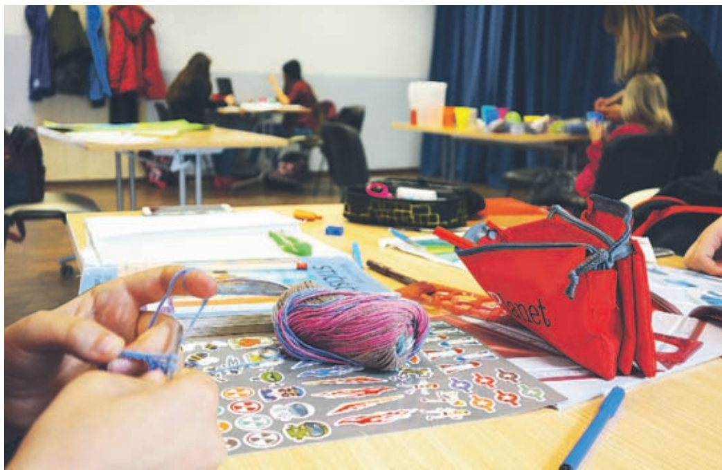
Reševanje ulomkov, risanje tangent, kvačkanje jopice, zlaganje origamija, izdelava plakata, naloga iz angleškega jezika – vse to so počeli posamezni obiskovalci dnevnega centra. Nato pa se lovili na dvorišču, igrali ročni nogomet, si pripravili malico ... res imajo pestre popoldneve.

Program je zasnovan tako, da vključuje tako čas za šolsko delo kot čas za sprostitvev in zabavo, v katerem je vedno prostor za več aktivnosti po izboru otrok. »Njihova prva naloga je, da opravi-jo šolsko delo. Nato je na vrsti