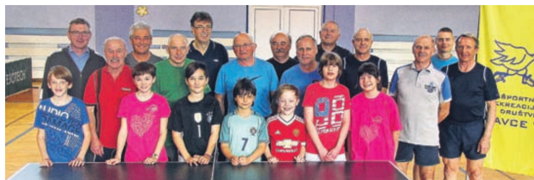
Letošnja udeležba na občinskem prvenstvu je bila skromnejša v primerjavi z minulimi.