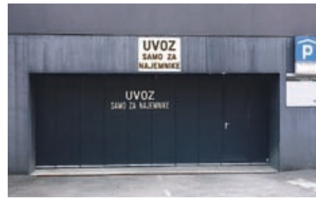
Najemnik lahko pogodbo za najem garažnega mesta v Pilon centru sklenejo tudi za en mesec.

Del pa jih je namenjen kratkotrajnemu dvournemu brezplačnemu parkiranju za obi-