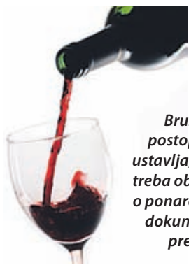
Bruseljski postopek se ustavlja, saj je treba obtožbe o ponarejenih dokumentih preveriti.

čiji in na Nizozemskem se je avstrijski kancler Christian Kern zavzel za skupno evropsko prepoved shodov turške skupnosti v članicah Evropske unije pred aprilskim referendumom v Turčiji.