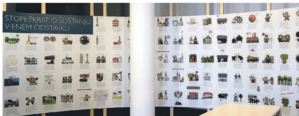
V obliki stalne razstave je na ogled (tudi) v občinski stavbi.

spešnejše projekte in programe, ki otroke in mladostnike uvajajo v arhitekturo grajenega prostora. Nagrada hkrati predstavlja