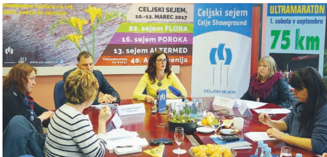
Organizatorji pričakujejo, da si bo letošnji spomladanski trojček ogledalo blizu 22 tisoč obiskovalcev ali 1000 več kot lani.

Na novinarski konferenci so predstavniki organizatorja prireditve obljubili veliko zanimivih vsebin. Na 22. sejmu Flora bodo znova opozarjali na pomen samooskrbe, napovedujejo ugodne nakupe semen, sadik, zelišč, trajnic in okrasnega drevja. V ponudbi bodo predvsem slovenske avtohtone sorte, po katerih je vse večje povpraševanje. Priložnost za spoznavanje in izmenjavo domačih semen napovedujejo znova v okviru Štáfete semen, ki jo tradicionalno pripravlja Ekoci –