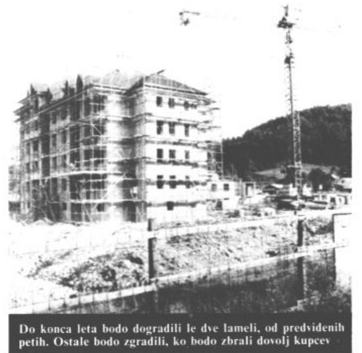
Do konca leta bodo dogradili le dve lameli, od predvidenih petih. Ostale bodo zgradili, ko bodo zbrali dovolj kupcev