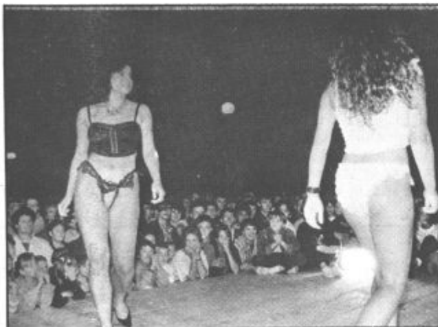
Ovacije so bile tako različne, da včasih kar ni bilo jasno ali gre za navdušenje nad perilom ali nad kom drugim.

zatišja spet raznesel nebo in ob stoterih bakljah je zagorela še jezerska voda. Brez dvoma pa velja, da so se obiskovalci najbolj razvneli ob kabaret showu z ženskim spodnjim perilom, KAJ TAKEGA PA ŠE NE!