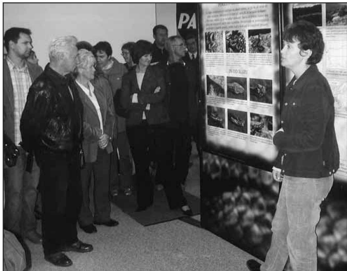
Zanimanje za razstavo o kačah je bilo izjemno.

D a kače niso tako nevarne, kot si to večinoma zamisljamo, je potrdil tudi izjemen obisk na poučni razstavi, ki jo je v sodelovanju z Zvezo za tehnično kulturo Murska Sobota in Prirodoslovnim muzejem Slovenije v svojih prostorih pripravil Klub PAC.