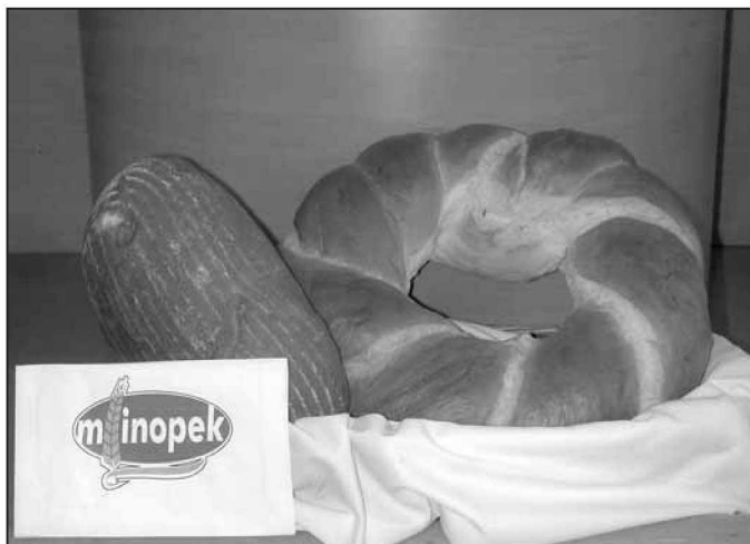
Nagrajena Mlinopekova kruha - rženi in vrtanek

Namen ocenjevanja je bil tudi letos enak - potrošniku zagotoviti stalno odlično kakovost te skupine pekarskih izdelkov.