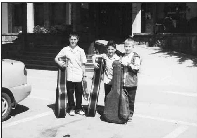
Udeleženci kitarškega tekmovanja v Leskovcu