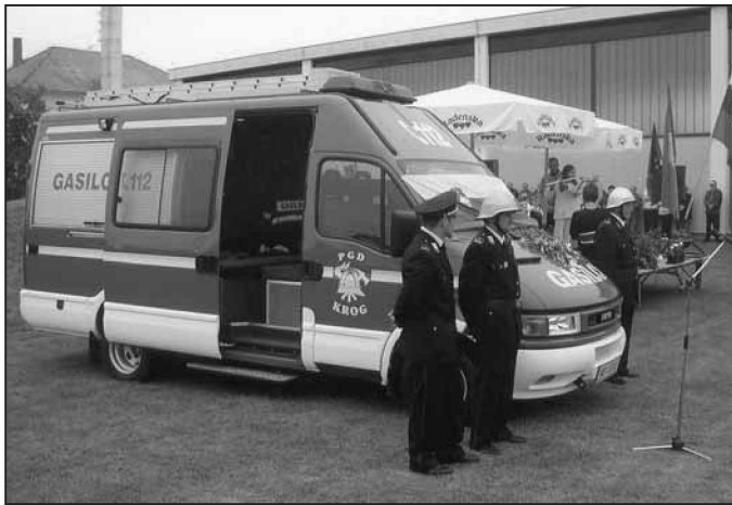
Novo gasilsko vozilo - dokaz, da so ljudje v Krogu gasilstvu zelo naklonjeni.

V primestnem prostovoljnem gasilskem društvu Gasilske zveze Mestne občine (GZMO) Murska Sobota v Krogu, so nekajletna prizadevanja tamkajšnjih gasilcev obrodila bogate sadove dela. Skupaj s krajani, okoliškimi gasilci in številnimi gosti so namreč namenu predali novo kombinirano vozilo. S tem so zamenjali dosedanje orodno vozilo, ki je bilo njihovo prvo in je namenu služilo natanko dve desetletji.