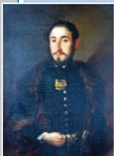
Portret Stanka Vra- za, iz 1841. leta