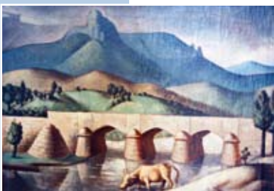
Oton Postružnik: Klek, 1929.