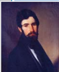
Portret Stanka Vra- za, iz 1841. leta