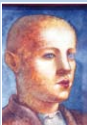
Glava postrizenega fanta, iz 1925. leta