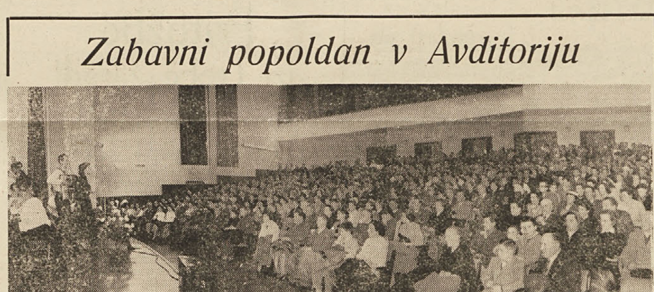
Zabavni popoldan v Avditoriju