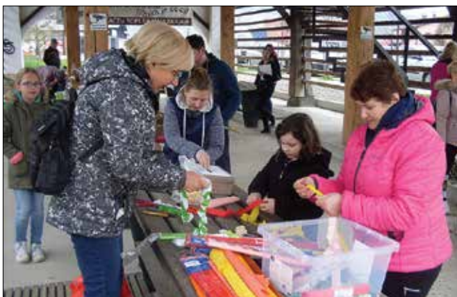
Izdelovanje okrasja v Bohačevem toplarju