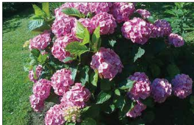
Zelenico krasi hortenzija čudovite barve.

Majda ima rada vse vrste rož. To se najbolj vidi poleti in zgodaj jeseni, ko sta dom in okolica vsa v cvetju. V vrtu rože pogosto zamenja. Pri nekaterih ji v oči pade barva, pri drugih oblika cvetov. Veli-