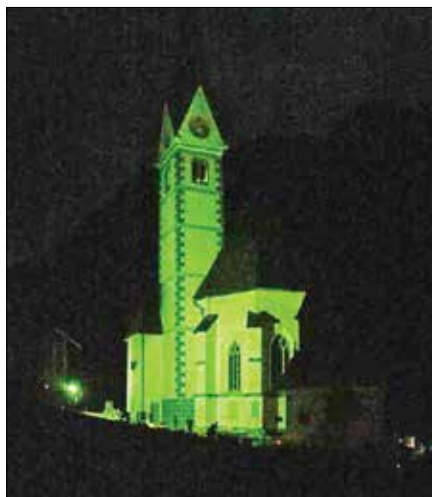
Solčavsko cerkev so ob dnevu sv. Patricka osvetlili drugače zaradi zelene naravnane destinacije. (Fotodokumentacija TIS Solčava)