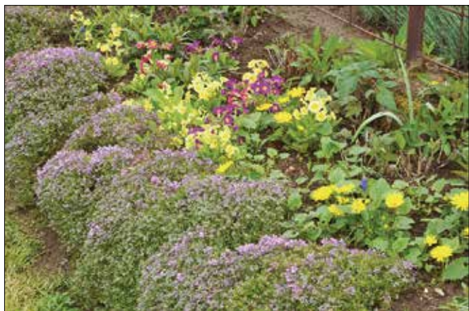
Kljub neprijetnemu vremenu in dežju je njen vrt že sedaj poln rožic v pisanih barvah.