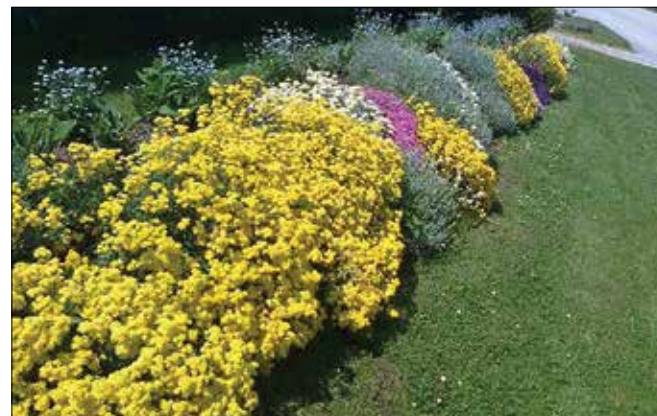
Poleti, ko vse cveti, je okrog Majdine hiše zelo barvito.

Kljub temu da ni več rosno mlada, vse delo pri domu opravi sama. Vsak dan se odpravi na enourni sprehod, ne glede na to, kakšno je vreme in koliko dela ima. To jo napolni z energijo, hkrati tako skrbi za zdravje. Najbolj zanimivo pa je, da