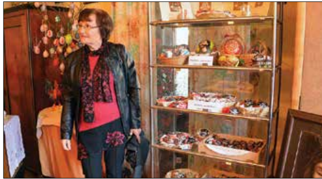
Razstavlja okrog trideset članov društev in posamezniki.