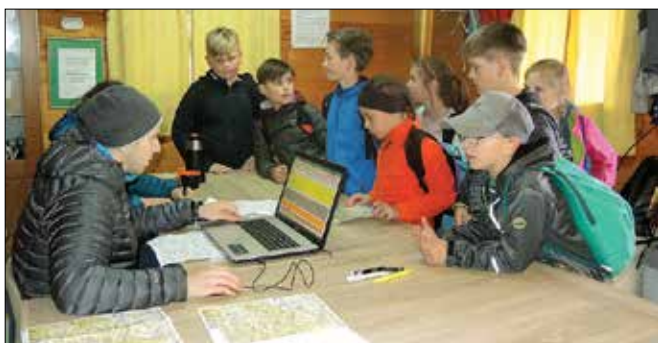
Mladi planinci so se po zaključeni poti javili na zadnji kontrolni točki v cilju na Lazah nad Kokarjah.

Tekmovanja so se udeležile ekipe iz planinskih društev Nazarje, Rečica ob Savinji, Slivnica pri Celju, Šoštanj in Zagor-