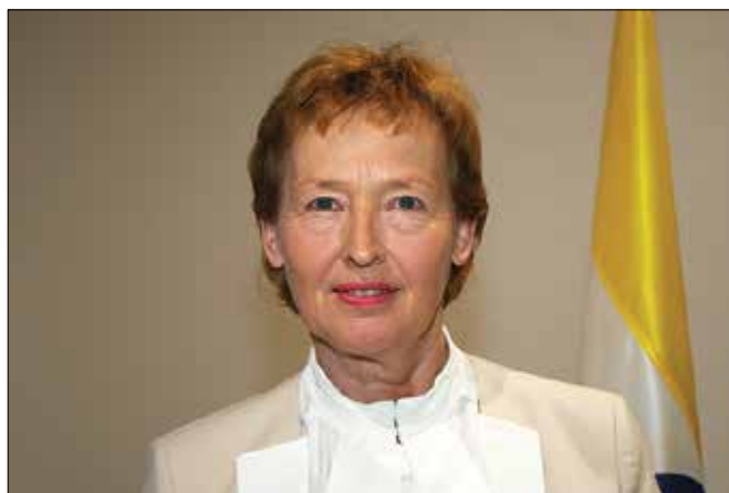
Zofija Mazej Kukovič je na več visokih položajih v različnih ustanovah Evropske unije.

V letu 2018 je bila izmed 28 predstavnikov držav EU, predstavnikov Evropske komisije in Evropskega parlamenta izvoljena za podpredsednico Management Boarda ECDC. Ta položaj ji daje možnost širjenja težnje k močnejšem sodelovanju vseh držav EU, pripadnosti vrednotam unije in ščititi državljane EU predvsem pred boleznimi, ki jih prinaša globalizacija, migracije ter globalni turizem.