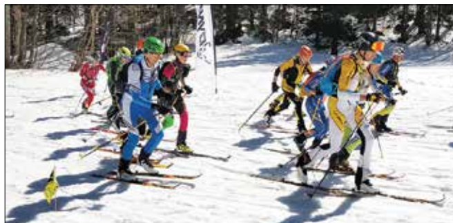
Člani GRS Celje so uspešno izpeljali tradicionalno turno smučarsko tekmovanje Memorial celjskih reševalcev.

Tekmovalce, ki so se razporedili v štiri tekmovalne kategorije, je pričakala 7 km dolga proga in kar 1.124 višinskih metrov razlike. Startali so