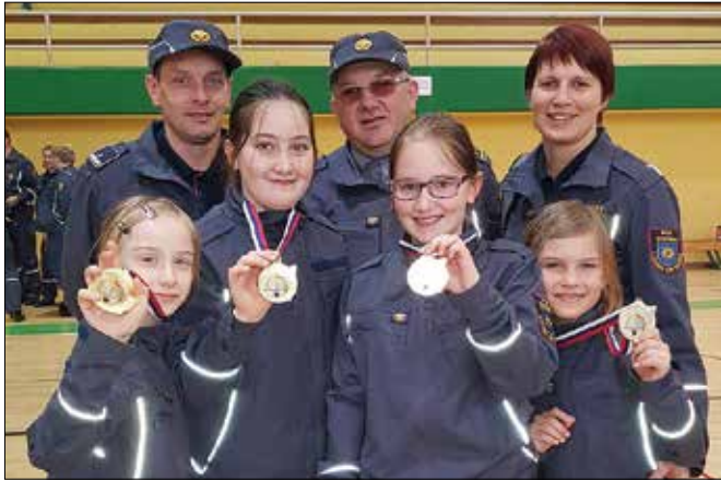
Okoninske pionirke so bile prve na regijskem in devete na državnem tekmovanju v gasilskem kvizu.