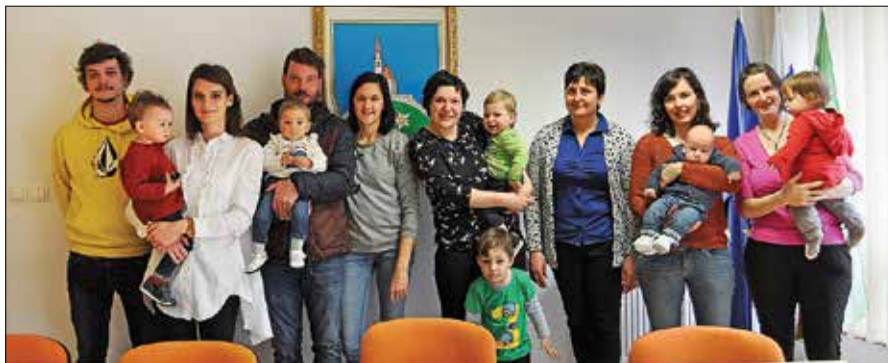
Na sprejemu je vladalo živahno in veselo vzdušje.