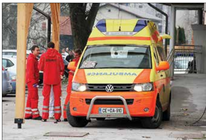
Kot doslej bodo reševalci prisotni v dolini, dežurni zdravnik pa bo, razen v času dežuranja v moziški ambulanti, prihajal iz Velenja.

Doslej je vladna delovna skupina našla možnosti za znižanje stroškov v višini 31,4 milijona evrov letno, za kar bo sicer potrebno spremeniti nekaj zakonov. Gre za nekatere naloge, ki ne sodijo v pristojnost občin, ampak države, kot so