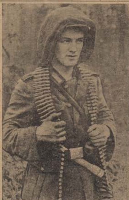
PK-Aufn.: Krgb. Schmidt-Scheeder (Wb.)

Vedeti je treba, da je sovjetska fronta v angleških in ameriških računih ena izmed največjih postavk. Za anglosaksonske sile je usodnega pomena, da ne morejo izdatno pomagati Sovjetiji, ki je bila dotlej tako