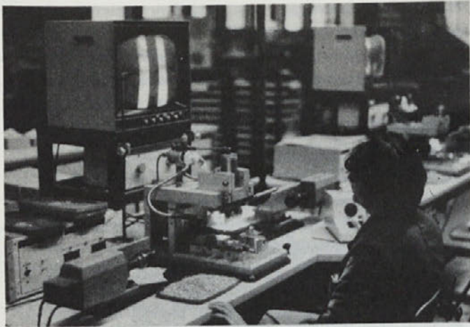
Zanimiv detajl iz proizvod.večplastnih kondenzatorjev

vija, sestavlja, impregnira in kontrolira kakovost ter nato gotove podsestave pošilja v Iskro Železniki za nadaljnjo montažo. Tako sodelovanje poteka na osnovi sklenjenega sporazuma tako, da se stalno dogovarjajo strokovne službe obeh kolektivov o planskih potrebah, transportu, kakovosti in njenemu nadzoru, tehnični pomoči, montažnih orodjih in pripravah ter osnovnih sredstvih, kako vse to najbolj ekonomično vskladiti. Oba kolektiva je vodila v tako sodelovanje samo ekonomska zakonitost obeh partnerjev. Seveda v tem sodelovanju včasih nastopajo tudi težave, ki pa jih uspešno premagujemo.