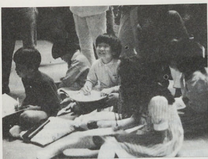
V Louvru

je po polurnem prekladanju obupan dvignil in ves zadovoljen sem zasedel svoje kraljestvo. Na žalost pa ugotovil, da je prav borno in sem le z veliko težavo zaspal, potem pa ni bilo problemov. Mislim, da bi se smilil celo sardinam v konzervi !