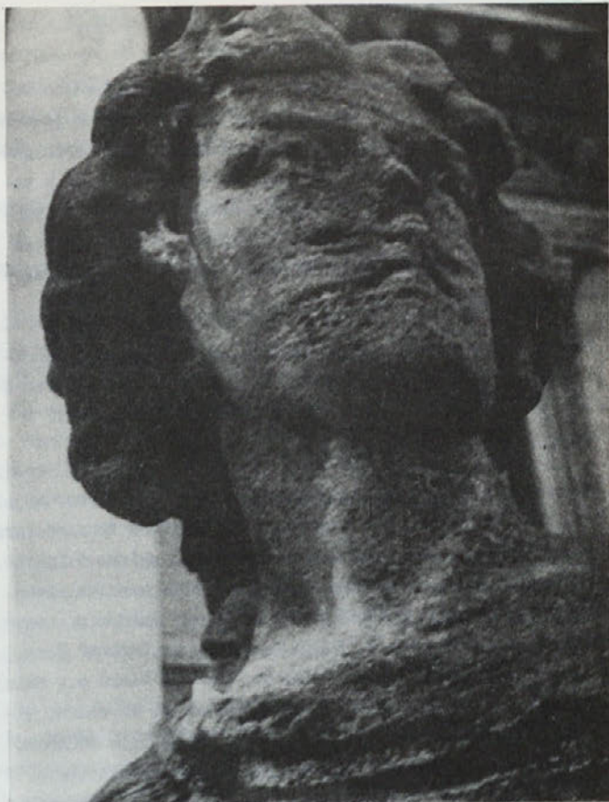
Delček umetnosti Bruslja

rizem vzel vso religioznost in služi povsem drugemu namenu; Louvre, v katerem tečeš maratonski tek od Egipta do danes. Iz njega pa prideš utrujen in z željo, da bi si lahko vzel vsaj teden dni časa in si natančno ogledal vse eksponate. Na Slovoloku zmage pa se ti odpre čudovit razgled po Parizu in z daljnogledom se lahko geografsko zelo dobro orientiraš. Tudi midva sva se napotila proti Eiflovemu stolpu. Na Slavoloku sva si ogledala še muzej. Najbolj mi je padlo v oči, da so razstavljene le fotografije zmag in ne tudi porazov. V spominu imam namreč Hitlerjev prihod v Pariz, v ozadju pa simbol zmage; te fotografije ni bilo v muzeju. Ah, potem se pač ne bi imenoval Slavolok zmage.