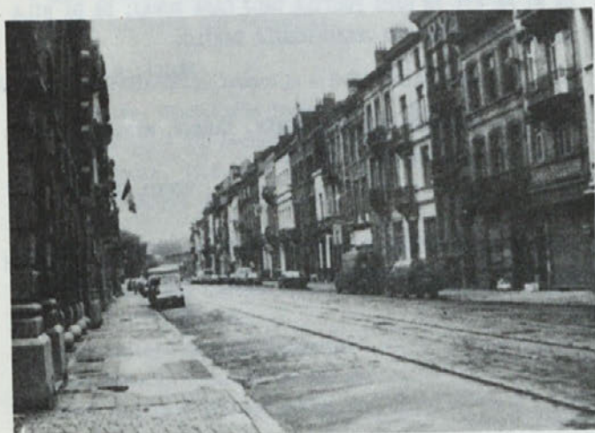
Pogled na eno izmed ulic v Bruslju