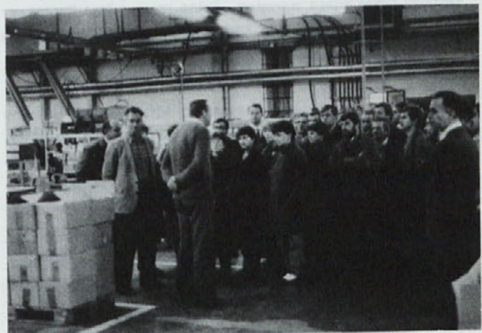
Razlaga o profes.proizvod. opreme za izdelavo kondenzatorjev

Že med kosilom so se oglašale harmonike, vendar je pravo veselje nastalo, ko je začel igrati ansambel Kristal. Ob letošnjem vinu, ki smo ga z veseljem poskušali, in ob veseli glasbi so seveda pete postale zelo lahke in člani obeh kolektivov so se pomešali v veselem pomenkovanju in plesu, ki je trajal vse do poznih nočnih ur, ko se je bi-