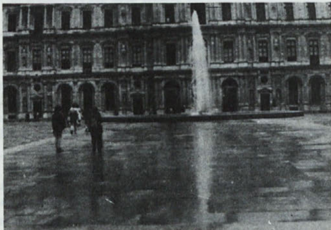
Pozdrav iz Pariza

Ogledala sva si Notre Dame - gotsko katedralo, ki ji je tu-