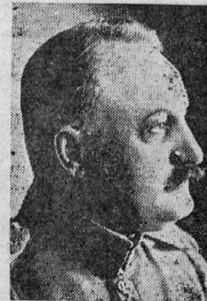
Minister vojske in mornarice general Pešić

Z grškimi zmagami je italijanska nevarnost na Jadranu vsaj začasno izginila za Jugoslavijo; z zasedbo Rumunske pa stoji Beograd sedaj pred dvojno nacistično nevarnostjo. In prej ali slej bo Hitler skušal poslati vojaško pomoč svojemu zavez-