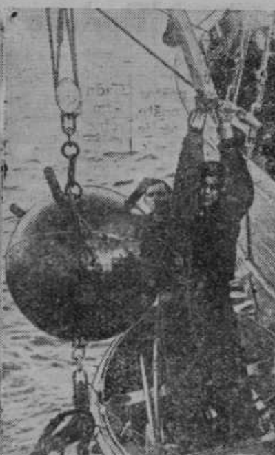
Nemški mornarji lovijo prosto plavajoče mine