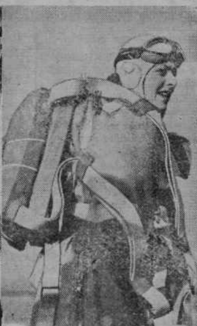
Tudi ženske že frčijo po zraku! Slika angleške letalke