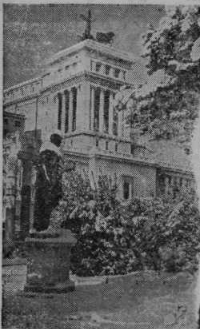
Silna redkost v Rimu: trg Venetia v snegu