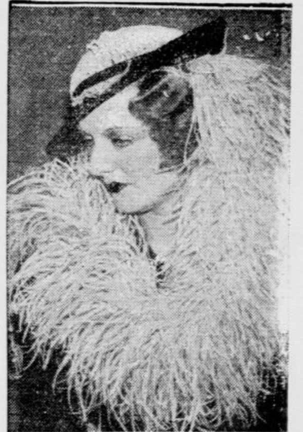
Elegantna dama krasi letošnjo pomlad svoj vrat s novejimi peresi