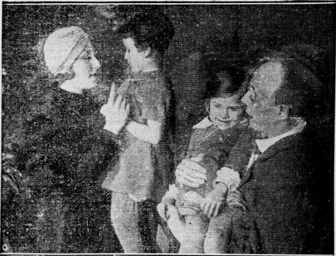
Miss Pariz izroča otrokom nagrade za najlepše napisana otroška pisma

na. Zgodovina nam pravi, da so se čisto tudi ženske hrabro borile; seveda, največkrat na obzidju. In omožena ženska je podobna posadki trdnjave; na močnem obzidju zakona in svoje čednosti ju naško odbija napade. Slabotnemu je pa posebno prijeten občutek, da mu daje varno obzidje tako moč.