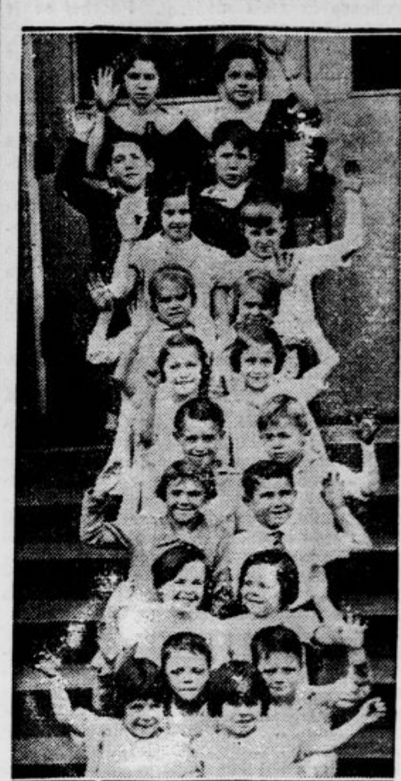
Neko ameriško osnovno šolo obiskuje kar dvajset dvojkov!