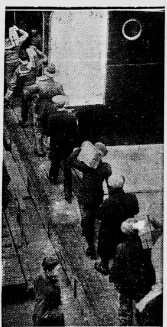
Angleško zlato prenašajo na ameriški parnik