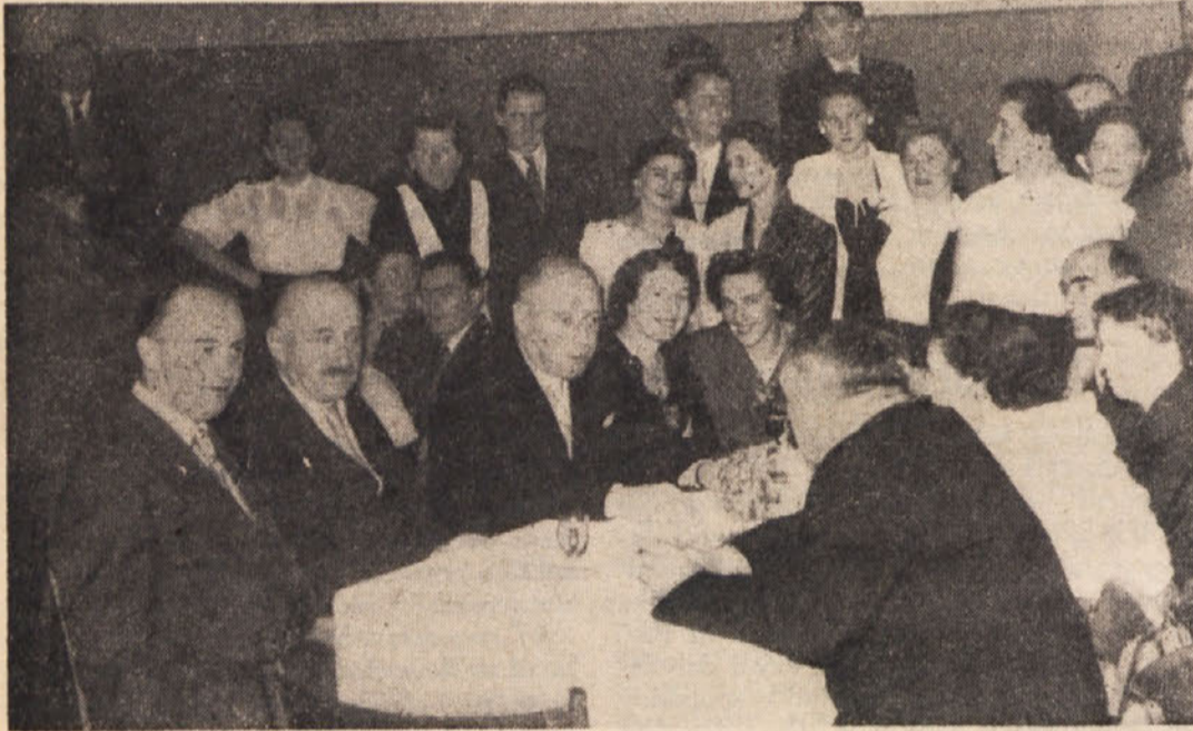
Omitzje z deželnim glavarjem