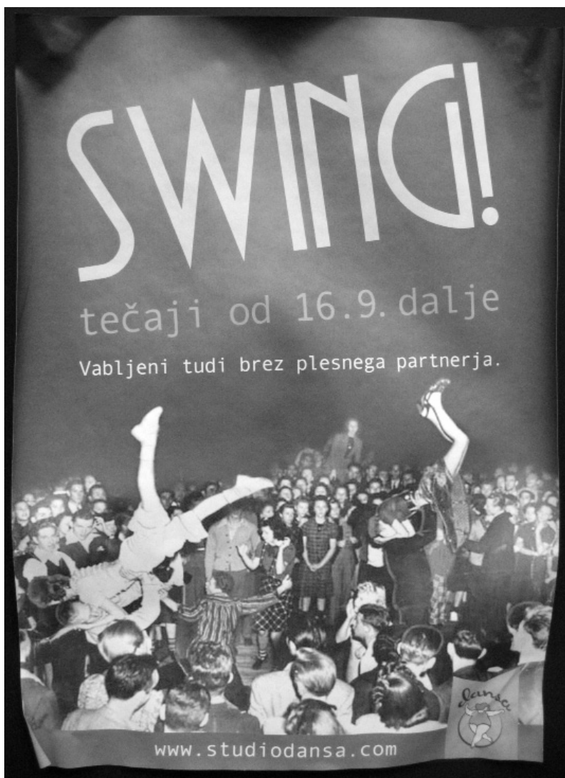
Slika 1: Oglas za začetek sezone tečajev leta 2013 pri ljubljanskem svingovskem društvu Studio dansa.

svingovskih nastopov (na primer na socialnih omrežjih in na samih dogodkih). »Kulturni kapital« (Bourdieu, 1984), ki izhaja iz tega vrednotenja, je seveda relevanten predvsem znotraj svingovskih institucij, kjer se plesno znanje pridobiva skozi tečaje, komunikacijo med učiteljem in učencem ter individualno treniranje plesnih parov, utrjuje pa se tudi na družabnem plesišču, ki ga sestavljajo zelo različni, bolj ali manj izučeni plesalci, ki skozi vzajemne plesne prakse spontano generirajo različne skupine in znanstva/prijateljstva.