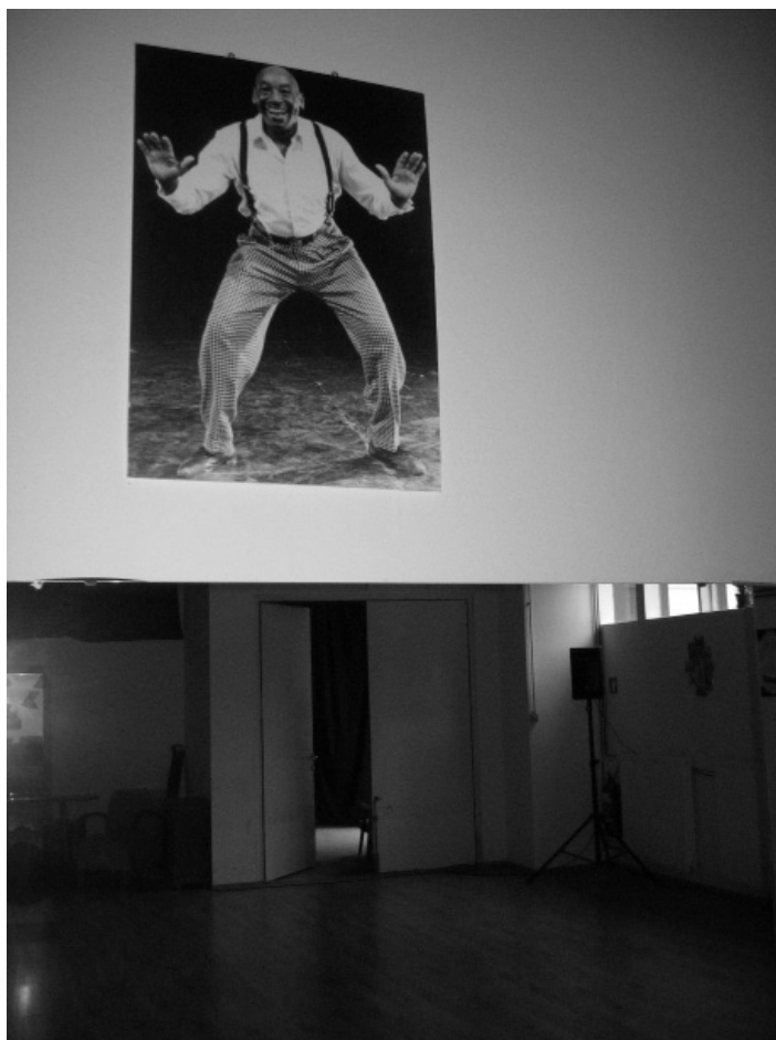
Slika 3: Plakat s podobo Frankieja Manninga v prostorih Studia dansa. Darilo zagrebških svingovcev ob otvoritvi decembra 2013.

glavno ulico, ki vodi skozi Herräng. Praznovanja Frankiejevih rojstnih dni od sredine 90. let spremljajo celotedenska praznovanja v New Yorku in številni lindihopski dogodki po svetu. Nadaljujejo se tudi po njegovi smrti (aprila leta 2009) in tako se spletni portal Youtube iz leta v leto polni s stotinami posnetkov plesanja koreografije Shim-sham-shimmy 25 in posebnih letnih koreografij v slogu Savoy lindihopa. 26