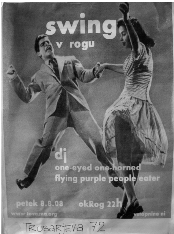
Slika 2: Plakat za svingovski večer rokenrolsko obarvane scene iz leta 2008.

središče predstavlja Studio dansa, imajo raje starejšo glasbo 20., 30. in 40. let, v središču njihovega plesa pa je zvrst lindihopa; 14 drugi, torej Swing kids in No sweat, pa so bolj usmerjeni v rock 'n' roll, rhythm & blues, rockabilly in novo svingovsko glasbo ter mešajo številne svingovske plesne zvrsti, vendar vsaj za učenje novincev izhajajo iz t. i. six count svinga 15 in vse pogosteje tudi sorodnega plesa bugivugi. Razlika med tema dvema scenama pa se ustvarja predvsem skozi glasbeni okus, saj se prvim zdi novejša glasba preveč »nabijaška« in za plesanje lindihopa premalo pestra, drugim pa se zdi starejša glasba preveč »cigu-migu« oziroma premalo energična in stimulatívna.