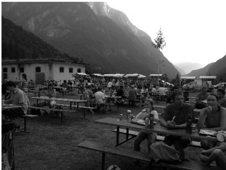
Slika 2: Trentarski senjem 2013, Trenta, 27. julij 2013.

tržnica kot zabava v mesecu juliju pa sta nedvomno privlačni za turiste, pohodnike in druge obiskovalce tega nenavadno množičnega in glasnega dogodka med gorami, prek katerega lahko spoznavajo še lokalno kulturo, ne samo narave.