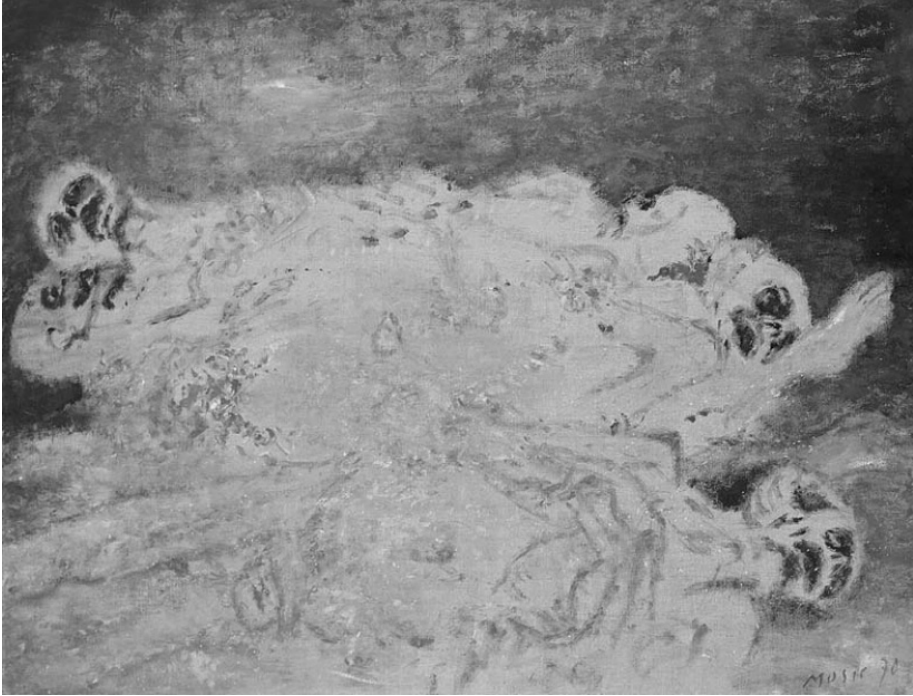
Slika 1: Zoran Mušič, Dachau , 1945, tuš na papirju, 33,5 x 47,8 cm, Moderna galerija, Ljubljana, inv. št. MG 238/R.

potrjuje tudi dejstvo, da so njegove risbe večinoma hranjene v umetnostnih zbirkah. 7 V Sloveniji jih, razen ciklostila v dveh odtisih, ki sta v Muzeju novejšje zgodovine v Ljubljani, hrani Moderna galerija v Ljubljani (Zgonik, 2012, 136).