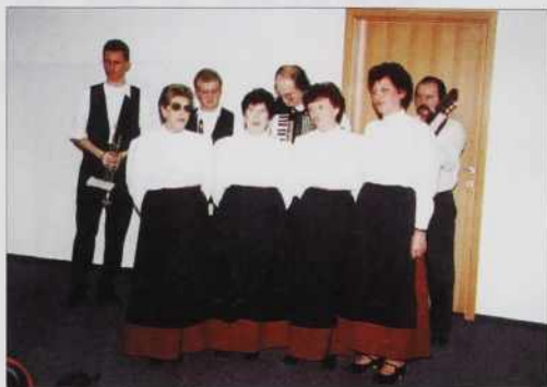
Ansambel L. Korpiča in ženski kvartet

tivirajo na redno delo. Vejmo, čutimo, ka mamu ka pobaugšati. Na tau mo té meli vekšo možnost, gda de Slovenski daum že delo z askom. Dočas vas prosim, bojmo zadovolni pa radi tomi, ka mamu. Vejmo, ka se vašoga trüda pa dela s pejnazi ne da plačati. Tau tü vejmo, ka vi ne delate za toga volo, liki zatok, ka s srca radi popejvate, plešate, igrate v svojoj maternoj rejči, radi ste vküper, ste radi, če lidi v