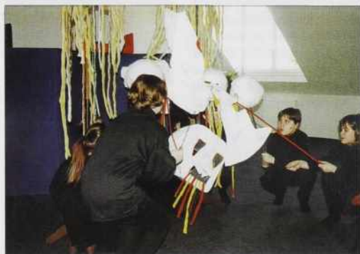
Lutkovna skupina OŠ Gornji Senik