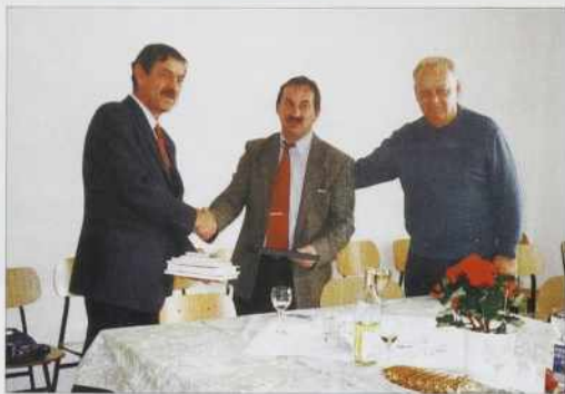
Predsednik Zveze Slovencev z gostiteljema

80 odstotkov občin v Sloveniji manjših, kot je naša mestna četrt. Delujemo v okviru mesta. Financiranje za delovanje je predvideno iz proračuna. Imamo tudi nekaj poslovnih prostorov, ki jih dajemo v najem, tudi od tega lahko pridobimo sredstva za naše delovanje. Za nas, krajane te mestne četrti je najbolj pomembno,