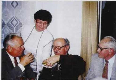
Ženske so pekle, moški so koštavali

na Verico i smo šli pejski prejk grajnce v Čepince, v Slovenijo. Zadvečara smo bili pri slovenski meši na Verici pa smo si poglednili kulturni program. Večerjali smo v restavraciji