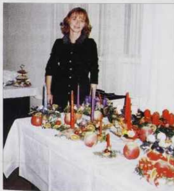
Adventni venci in božični aranžmaji cvetličarne Mojca iz Bodonec ter pridelki Sadjarstva Smodiš, na razstavi ob dnevu manjšin