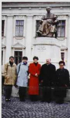
Gostje s Cankove