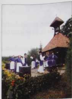
Folklorna skupina Sakalovci

tivirajo na redno delo. Vejmo, čutimo, ka mamu ka pobaugšati. Na tau mo té meli vekšo možnost, gda de Slovenski daum že delo z askom. Dočas vas prosim, bojmo zadovolni pa radi tomi, ka mamu. Vejmo, ka se vašoga trüda pa dela s pejnazi ne da plačati. Tau tü vejmo, ka vi ne delate za toga volo, liki zatok, ka s srca radi popejvate, plešate, igrate v svojoj maternoj rejči, radi ste vküper, ste radi, če lidi v