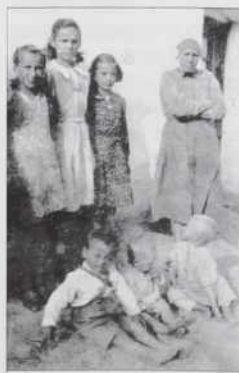
Sem mislo, ka smo vsi bratje in sestre