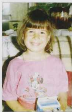
Vnúkice žitek je že ovakši.