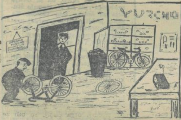
Kolega, ali je to nova delavnica za popravilo koles? Ne, to je radioklub študentsko naselje!

M LADI KADRI: Na našo almo mater prihajajo vse boljši in znanja popolni kadri. Tako se nam dogaja, da nam, stariim bajtam, profesorji očitajo, češ: kaj boste vi; ti, ki prihajajo za vami, so bolj znatizeljni in so v splošni izobrazbi daleč pred vami, stariim študenti, ki študirate že po dve, tri ali trikrat tri leta. Našim spoštovanim profesorjem v poduk in majhno opozorilo, ki je predvsem dobronamerno, da sporočamo tole: