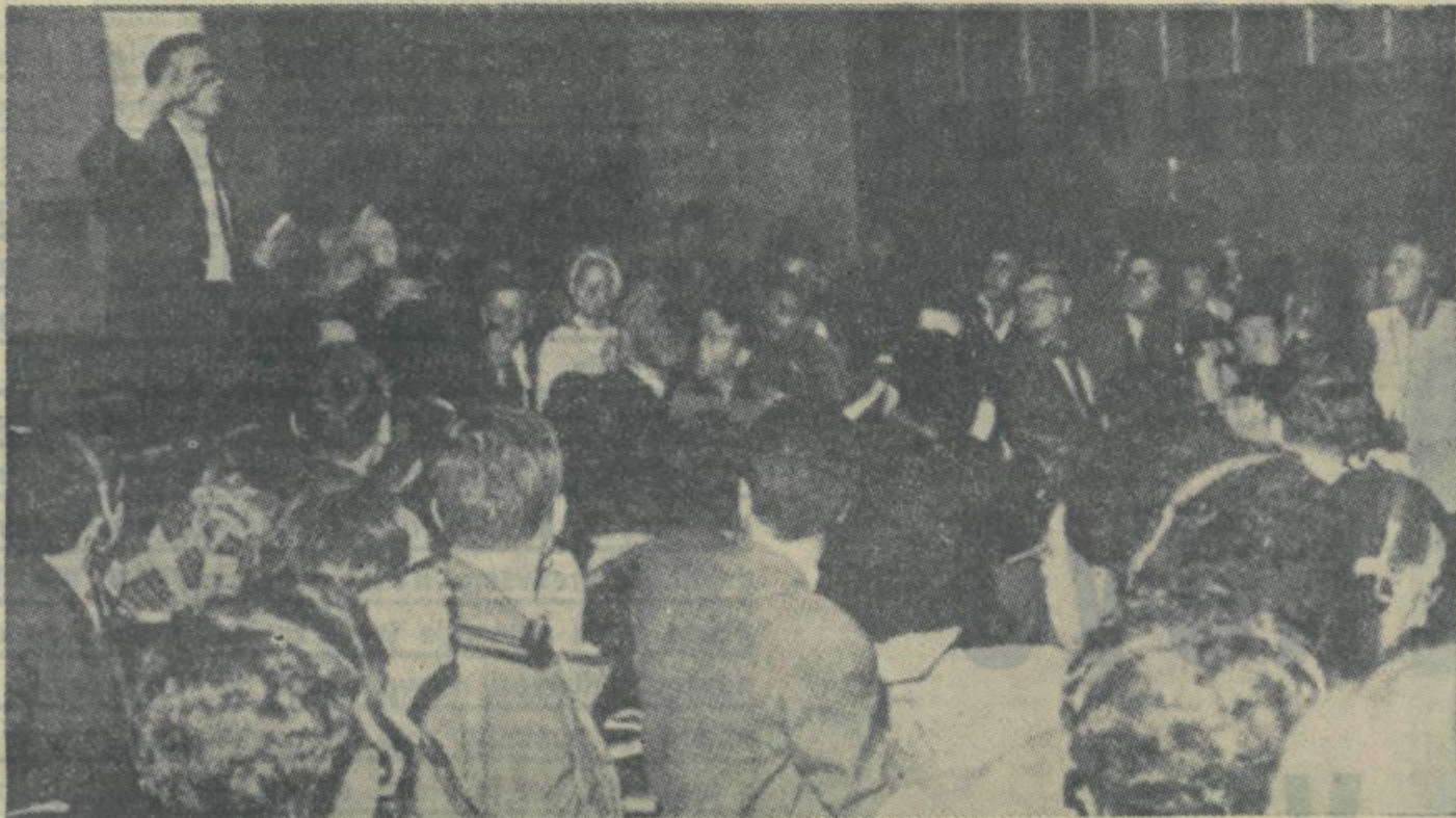
Član Zveze študentov priporoča študentom Sorbonne, da se naj premaknejo z mrtve točke