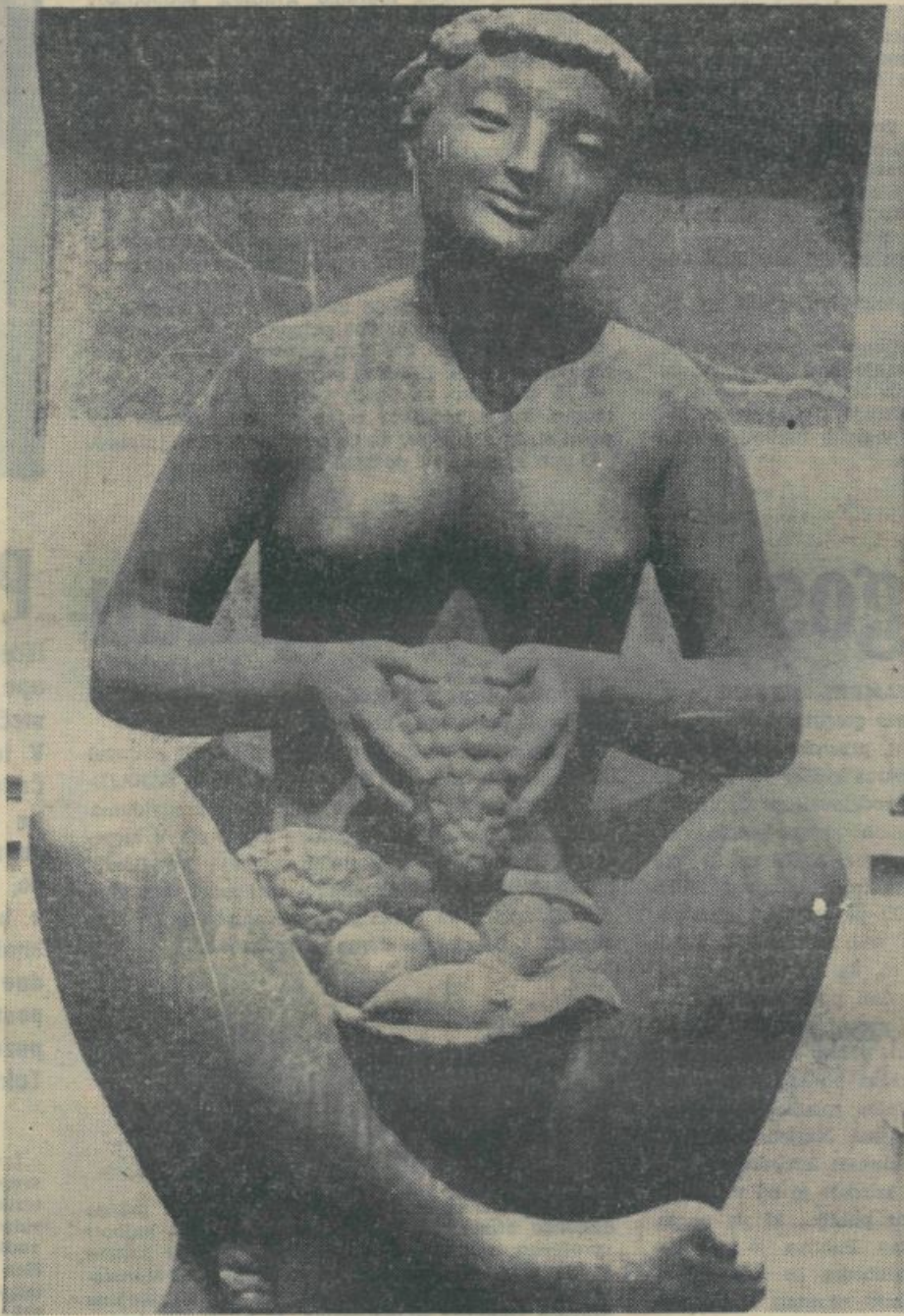
bliranje, ker imamo še eno tovrstno šolo, ki lahko v celoti zadovolji slovenske potrebe po predavateljih estetske vzgoje. Če k temu dodamo potrebo po prostoru,

Statut akademije torej zagotavlja, da bo akademija šolala ustvarjalne in tako imenovane reproduktivne kadre za umetniška področja, ki jih zajema njen delokrog. V tem primeru postaja vprašanje formiranja večerne filmske šole nepomembno, saj bi njena ustanovitev pomenila udu-