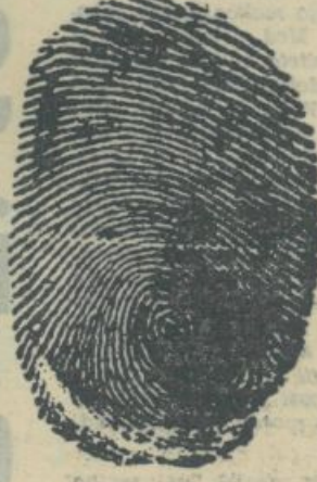
Podpis nekega direktorja

Torej, poleg različnih študijskih programov in kriterijev, s katerimi se srečujejo ptice selivke na naših univerzah, imamo tudi kriterije pri karikiranju pojavov iz naše sedanosti.