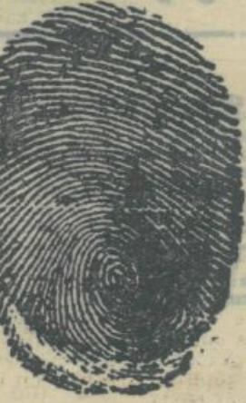
Podpis nekega pisatelja

Rdeča kapica je dolgo, dolgo stopicala okrog babičine hišice in klicala babico. Toda babica se ni oglasila, kako