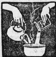
Raztopite med neprestanim mešanjem zavoj Rinsa v 3 do 4 litih vrele vode.